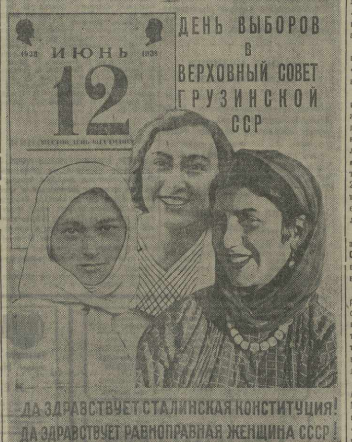
ДА ЗДРАВСТВУЕТ СТАЛИНСКАЯ КОНСТИТУЦИЯ! ДА ЗДРАВСТВУЕТ РАВНОПРАВНАЯ ЖЕНЩИНА СССР!

Рабочие и служащие Батумского порта и портовых мастерских единогласно постановили наметить первым кандидатом в депутаты Верховных Советов Грузинской ССР и Аджарской АССР великого вождя народов СССР товарища Сталина и выдвинули кандидатуры сталинского поколения, зорко охраняющего счастливую жизнь советского народа, товарища Николая Ивановича Ежова и секретаря ЦК КП(б) Грузии товарища Л. П. Берия.