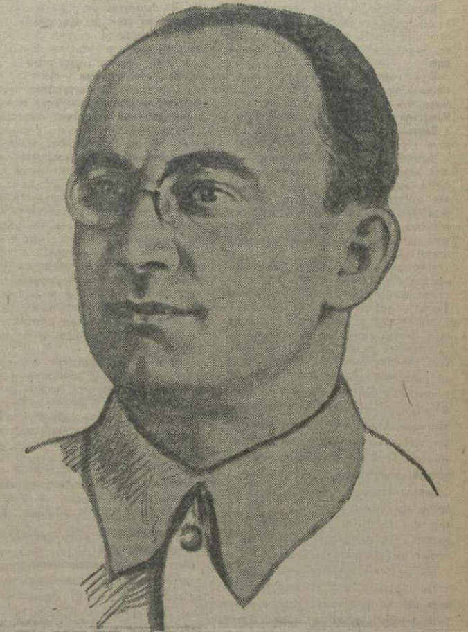
Л. П. БЕРИЯ