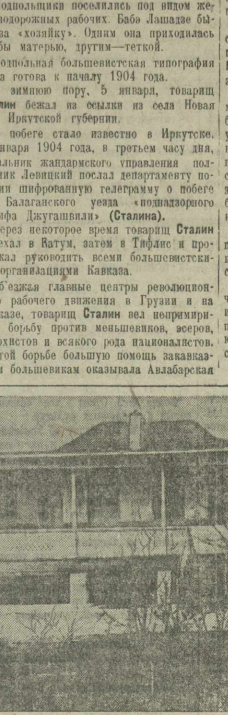
Общий вид реставрированной Авлабарской подпольной большевистской типографии.