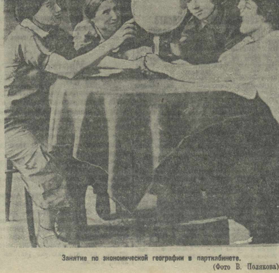
Занятие по экономической географии в парткабинете.

Большое значение в деле воспитания кадров в духе интернационализма имеет систематическое ознакомление наших рабочих с героической борьбой испанского и китайского народов против фашистских интервентов и захватчиков. Выплачивание национальных кадров пропагандистов и агитаторов, правдивое их использование, выживание и помощь в их работе также служат делу интернационального воспитания.