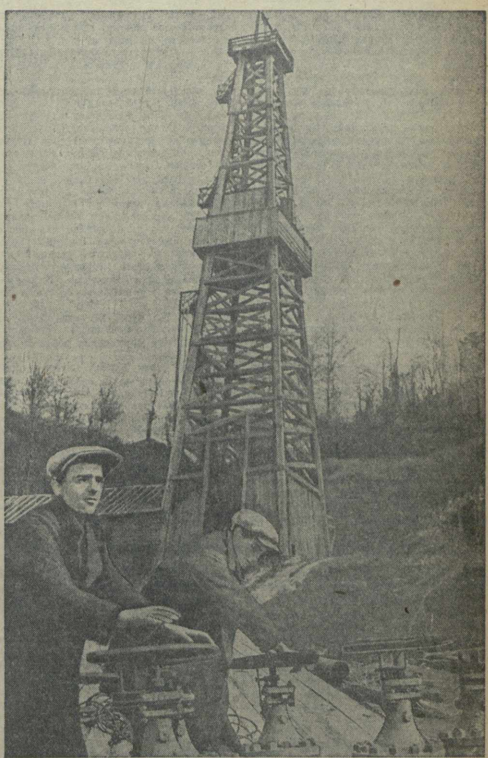
Буровая № 3 на нефтеразведке в Супсе 2 апреля дала промышленную нефть. На снимке: начальники буровой С. Новоров и механик И. Вериго за работой по монтажу арматуры.