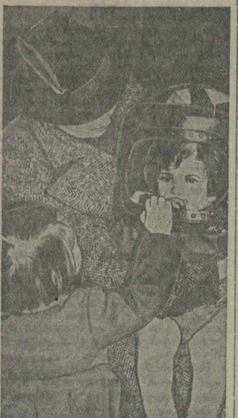
В Англии сконструирован новый противогаз для детей. На снимке: новый детский противогаз.