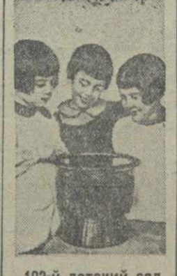
102-й детский сад района имени Орджоникидзе. Дети у авариума.

Всесоюзное совещание спортивного общества «Спартак» приурочило Грузинскому совету общества и физкультурному коллективу артели «Дан-Мауду» переходящие знамена за лучшее выполнение обязательств социалистического соревнования. Знамена будут вручены на днях на всегрузинском активе общества «Спартак».