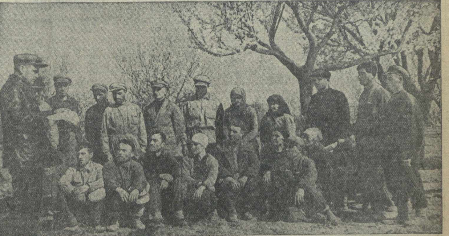
Колхоз имени Махарадзе вызвал на соревнование имени третьей сталинской пятилетки колхоз имени Берия, сел. Авчала. На снимке: обсуждение условий договора в колхозе имени Махарадзе.

На кораблях флотских и флотов Рабоче-Крестьянского Военно-Морского Флота широко развернулось социалистическое соревнование имени третьей сталинской пятилетки.