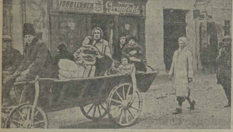
В результате последнего передела Центральной Европы территория Карпатской Руси занята венгерскими войсками. Окупанты установили на захваченной территории режим жестокого террора. Спасая свою жизнь, мирное население покидает родные места. На снимке: беженцы из Карпатской Руси, прибывшие в гор. Ситет (Румыния).