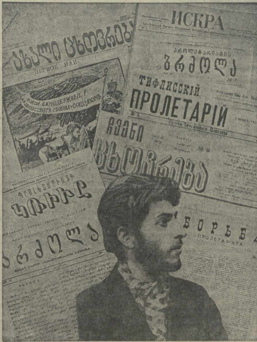
Рабочие часто жаловались, они были недовольны легальной газетой «Квади», которую им старались вручить «легальные марксисты», и жаждали иметь свою нелегальную рабочую печать, в которой находили бы отражение насущные вопросы борьбы рабочего класса.

Передовые рабочие, большевистские пропагандисты, подготовленные, воспитанные Сталиным, пользовались сталинской работой «Вскользь о партийных разногласиях» и книгой Ленина «Что делать?», в защиту которой выступил товарищ Сталин в своей брошюре.