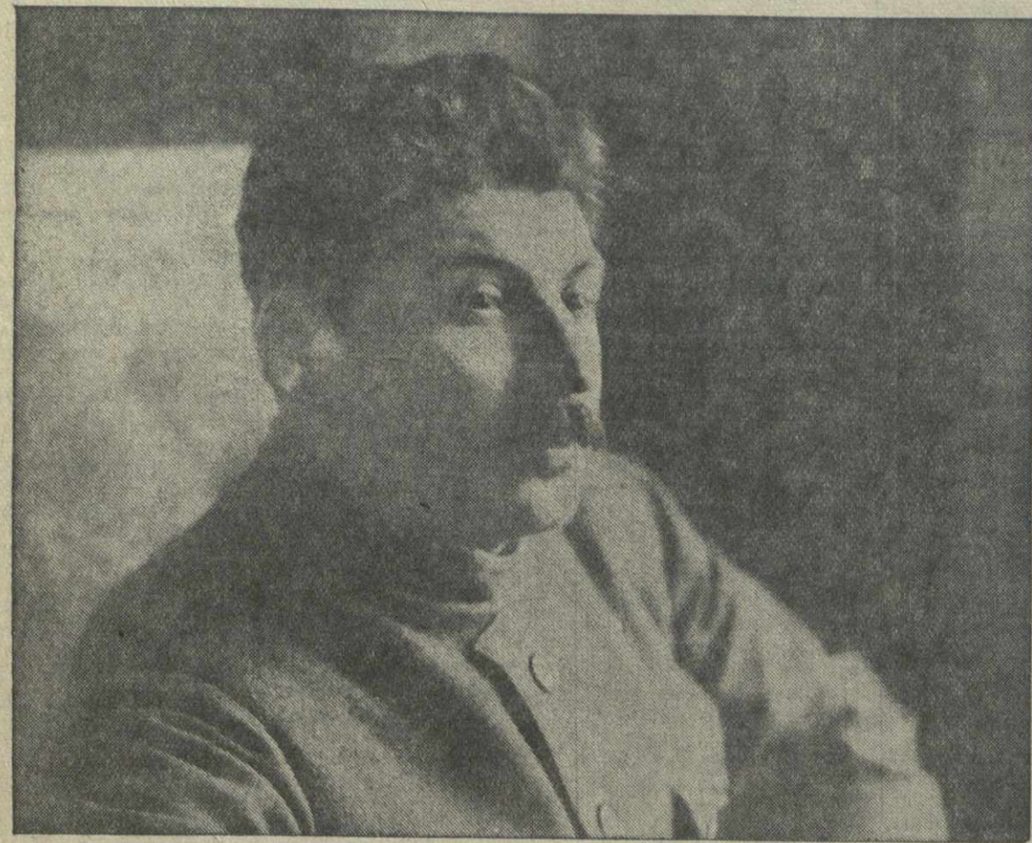
И. В. СТАЛИН (1921 г.) (Из материалов Тбилисского филиала Института Маркса-Энгельса-Ленина). Снимок публикуется впервые.

«Печать — единственное орудие, при помощи которого партия ежедневно, ежечасно говорит с рабочим классом на своем, нужном ей языке. Других средств протянуть духовные нити между партией и классом, другого такого гибкого аппарата в природе не имеется».