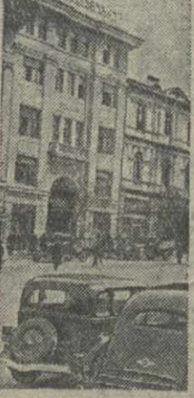
Тбилиси. На площади им. Л. П. Берия.