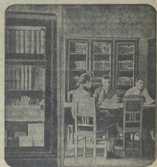
Гори. Библиотека-читальня в сельскохозяйственном техникуме имени СТАЛИНА, в здании бывшего духовного училища, в котором учился товарищ СТАЛИН.