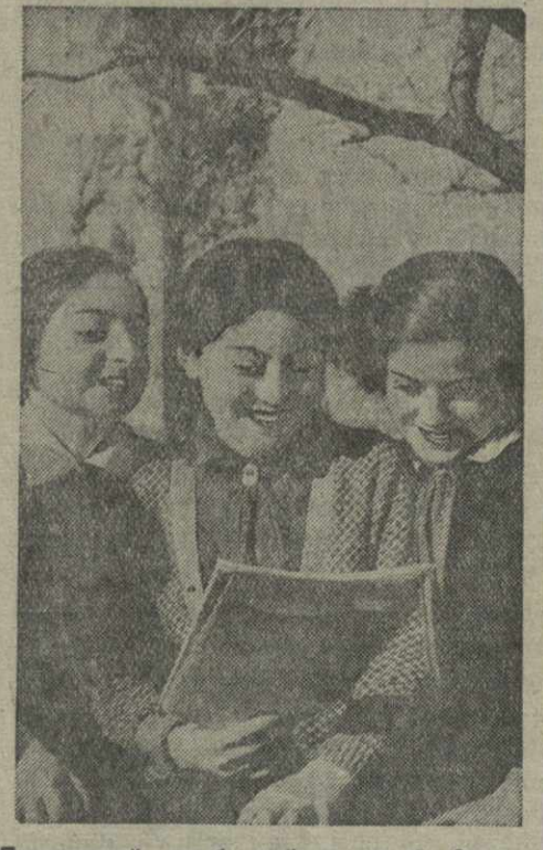
Пионерский клуб района им. С. Орджоникидзе (Тбилиси). На сцене: пионеры на отдыхе.

Медицинский, Фармацевтический и Стоматологический институты Тбилиси выпускают в этом году 615 молодых врачей и фармацевтов. Привезенная в Тбилиси специальная комиссия Наркомздрава Союза распределила оканчивающих институты среди лечебных учреждений. Большинство молодых врачей и фармацевтов выезжает в районы. Многие выражали желание работать на Дальнем Востоке, на крайнем Севере, на железнодорожном и водном транспорте. Выпускные экзамены начнутся в Медицинском и Фармацевтическом институтах 13 мая, а в Стоматологическом институте — 15 мая.