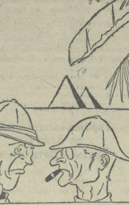
В английской колонии — На английском холмике — франкские негры будут объявлены «угнетенными немцами»?