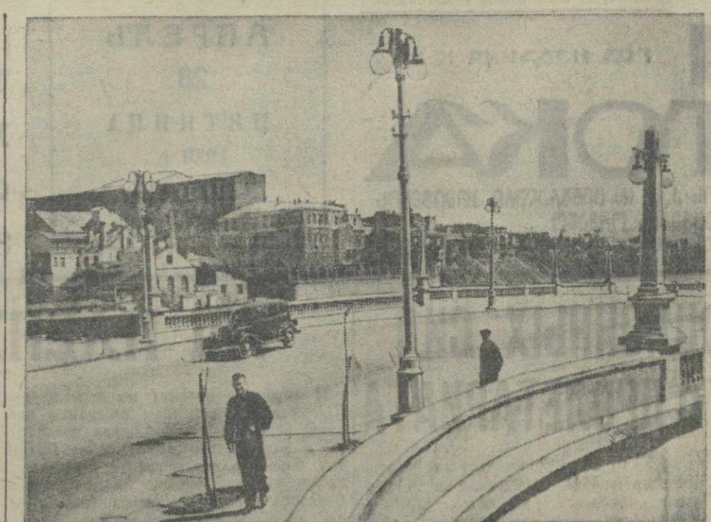
Тбилиси. На набережной имени СТАЛИНА.

* Как сообщает газета «Словенская правда», словенское правительство вынесло 24 апреля решение об увольнении всех евреев, занятых в государственных учреждениях. (ТАСС). * По сообщению агентства Гавас, бывший премьер-министр испанского республиканского правительства Негрин, отправляется из Гава в Америку на французском пароходе «Нормандия». (ТАСС).