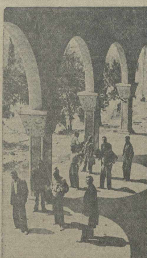
На отаждне «Динамо».

Станция Тбилиси принимает меры к улучшению обслуживания в летнее время пассажиров, в частности курортников. Сейчас идет подготовка кассиров, перронных контролеров и других работников, обслуживающих пассажиров. Станция увеличила число билетов для кассиров-альпинистов. Улучшается работа бюро обслуживания. Предполагается открыть специальную билетную кассу для пассажиров-курортников. В помещении вокзала отремонтированы верхний зал. Приведена в порядок мебель в пассажирских залах. Сейчас в ремонте — дальний павильон. Неподалеку от станции разбивается сквер. Для улучшения работы багажного отделения расширен один из его складов, пополнен инвентарь. Багаж принимается в первую очередь по билетам пассажиров. Выделена специальная касса для камер хранения. Жены работников и работницы станции организовали бригады содействия культурному обслуживанию пассажиров.