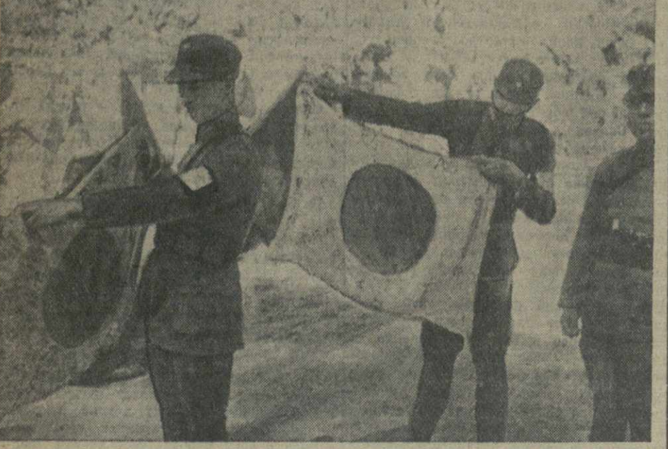
Командиры китайской армии рассматривают боевые знамена, отобранные у японских захватчиков.

★ Как сообщает агентство Юнайтед пресс, между Колумбийей (республика в Южной Америке) и Германией заключено соглашение, по которому немцы, проживающие в Колумбии, могут проходить военную подготовку в колумбийской армии, а колумбийцы, проживающие в Германии, — в германской. (ТАСС). ★ 13 мая в Лондоне вблизи ряда общественных зданий произошло четыре взрыва бомб, подорвавших неизвестными лицами. Одна бомба взорвалась около станции метро «Блуждер роуд». (ТАСС). ★ За последние месяцы в Чехии и Моравии закрыты 2 тысячи газет и журналов. (ТАСС).