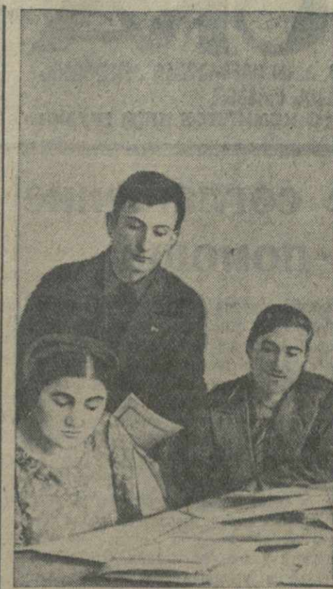
В читальне тбилисского сельскохозяйственного института им. Берия.