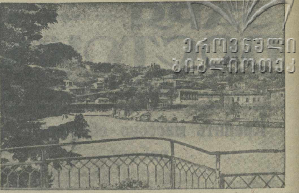
На берегу Риуни в Кутаниси.