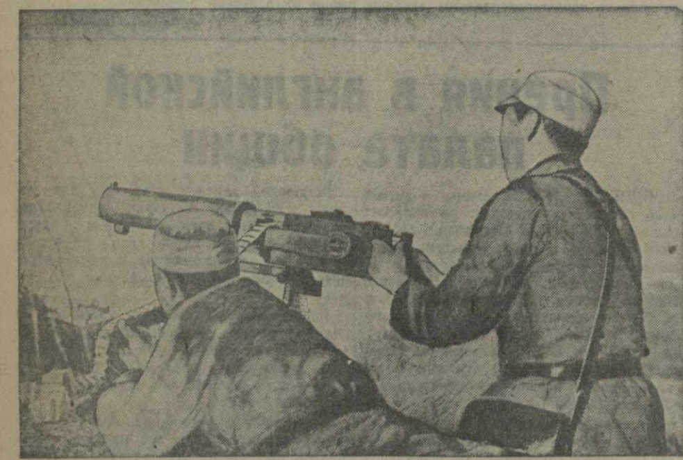
Пулеметчики китайской армии в горах северной Хунани.

17 мая китайская авиация бомбардировала японские позиции в окрестностях Ханчжоу. Разрушен японский военный склад. Наступлению китайских самолетов вынуждена была японская истребительная авиация. В воздушном бою серьезно повреждены два японских самолета. Китайские самолеты благополучно вернулись на свои базы. В этот же день китайские самолеты подвергли ожесточенной бомбардировке японские позиции вдоль реки Синьян (западнее Кантона). Разрушен ряд японских оборонительных укреплений и повреждены четыре японские танкера.