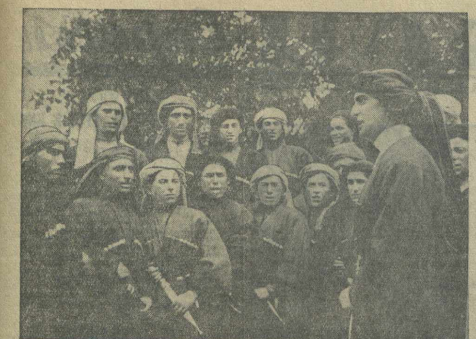
Хор колхоза-миллионера имени Ленина сел. Онуми, Гальского района, готовится к выступлениям на Всесоюзной сельскохозяйственной выставке.