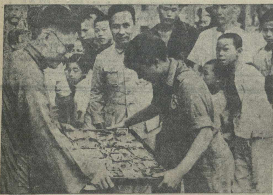
Итайская молодежь проводит обор средств на укрепление обороны страны. На снимке: юный общинник передает собранные им средства.