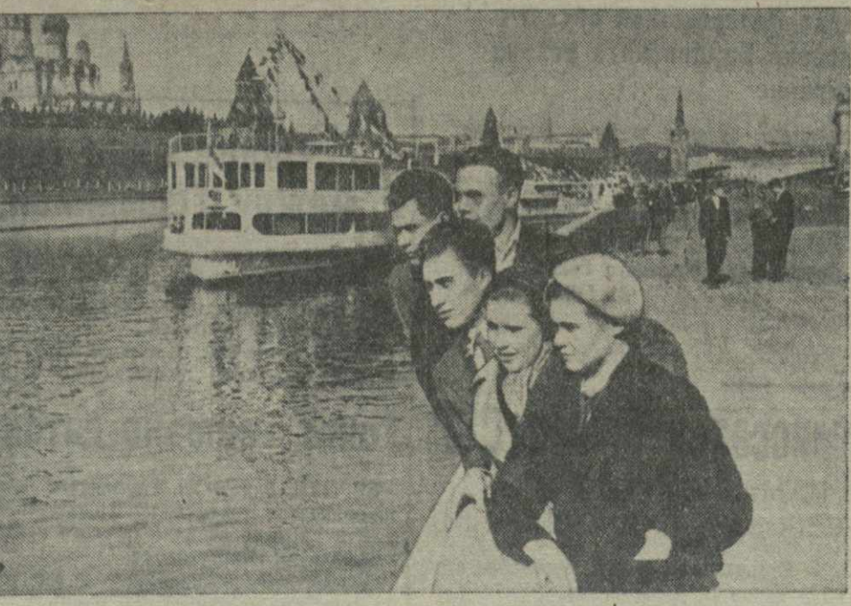
Москва. Флотилия теплоходов канала Москва—Волга у стен Кремля.

На митинге, состоявшемся на стадионе «Динамо», выступил командор и поллитрук велопробега тов. Тимохов. — С момента старта, — сказал он, — нами пройдено свыше тысячи километров. Команда чувствует себя отлично, все в порядке. Думаем неспроста совершить не более чем за 95 холмов дней. Завтра в 17 часов велосипедисты отправляются в дальнейший путь.