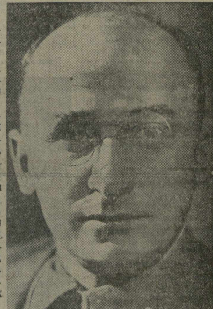
Депутат Верховного Совета Грузинской Советской Социалистической Республики Лаврентий Павлович БЕРИЯ.