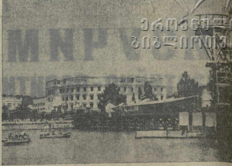
Сухоуми. Вид на набережную и гостиницу «Абхазия».

25 июня, в 7 часов вечера, в Пальмовом Ордоникидзевоком РК ТЮБ Грузии состоится отчетное собрание профсоюзной организации. Присутствие профсоюзных работников обязательно.