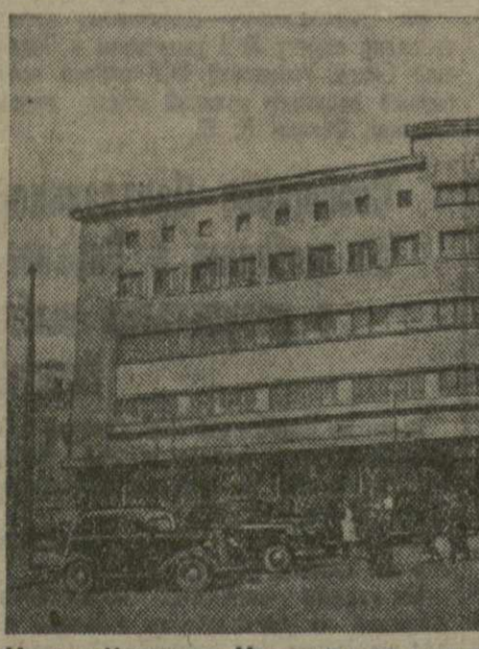
Москва, Универсам Мосворцевого пром торго на Даниловской площади.

СЕВАСТОПОЛЬ, 26. (ТАСС). Над бухтой засияло безоблачное голубое небо. Боевые корабли украсились праздничными флагами. Еще задолго до победы палуба эсминца «Дагерский» покрылась белыми форменками краснофлотцев, пожелавших первыми отдать свой голос за верного сына народа, сталинского наркома товарища Н. И. Ежова, баллотировавшегося в депутаты Верховного Совета Крыма по Центральному избирательному округу № 96 города Севастополя.