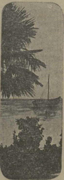
На гагринском побережье.

Расстояние от Тбилиси до Орджоникидзе они наметили пройти за 8 дней. Участники похода взяли с собой палатку и питание.