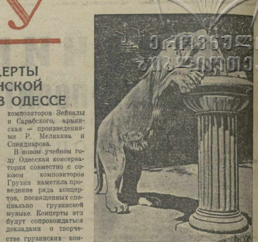
Жарко „Теймураз“ у колонны.

Для музыкального оформления картины народным артистом СССР Л. П. Штернбергом использована музыка Глинка к опере „Русская и Людмила“.