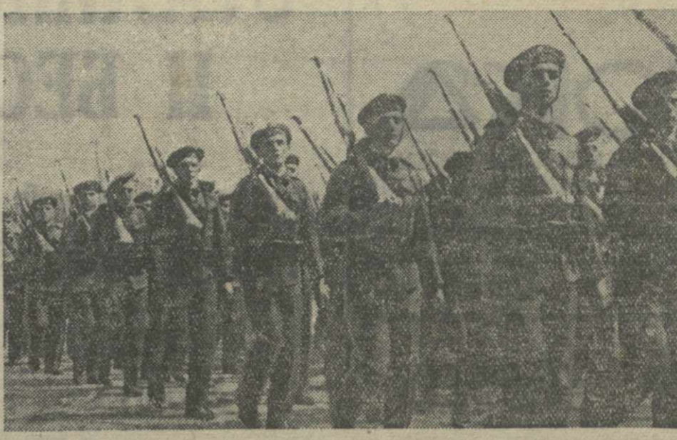
Пехотные части чехословацкой армии в походе.