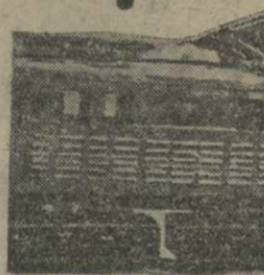
Юный конструктор. (На Центральной детской технической станции в Тбилиси).