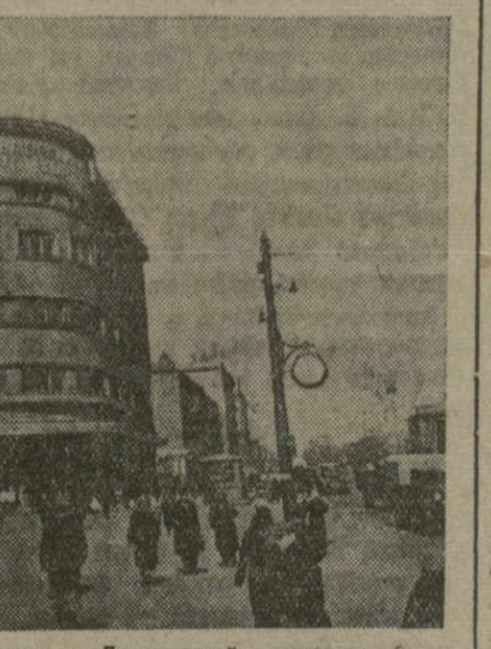
Москва, Универсам Мосворцевого пром торго на Даниловской площади.

ХАБАРОВСК, 26. (ТАСС). Пассажиры курьерского поезда Москва — Хабаровск встретились с участковой избирательной комиссией в 3 часа ночи на станции Ушуму, Амурской железной дороги.