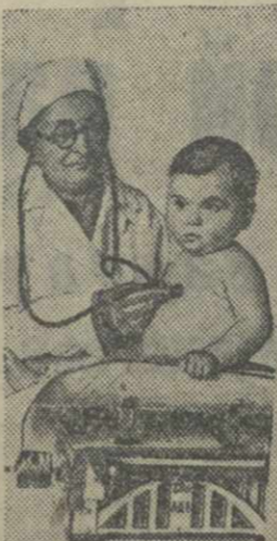
Врачебная консультация в детском яслях Наркомсвязи (Тбилиси)

Недавно во время буровых работ в сел. Ошпарети, Ланчутского района, с глубиной 50 метров забия сильный фонтан нефти.