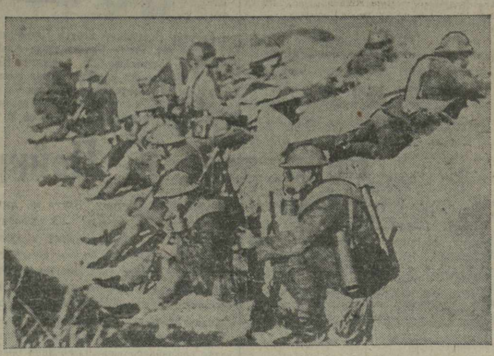
Китайская воинская часть в противозах.

и теор. механике для студентов заоч. курсов — ул. Горького (Красногорская), № 5, 1-й под'езд 2-й этаж 3119