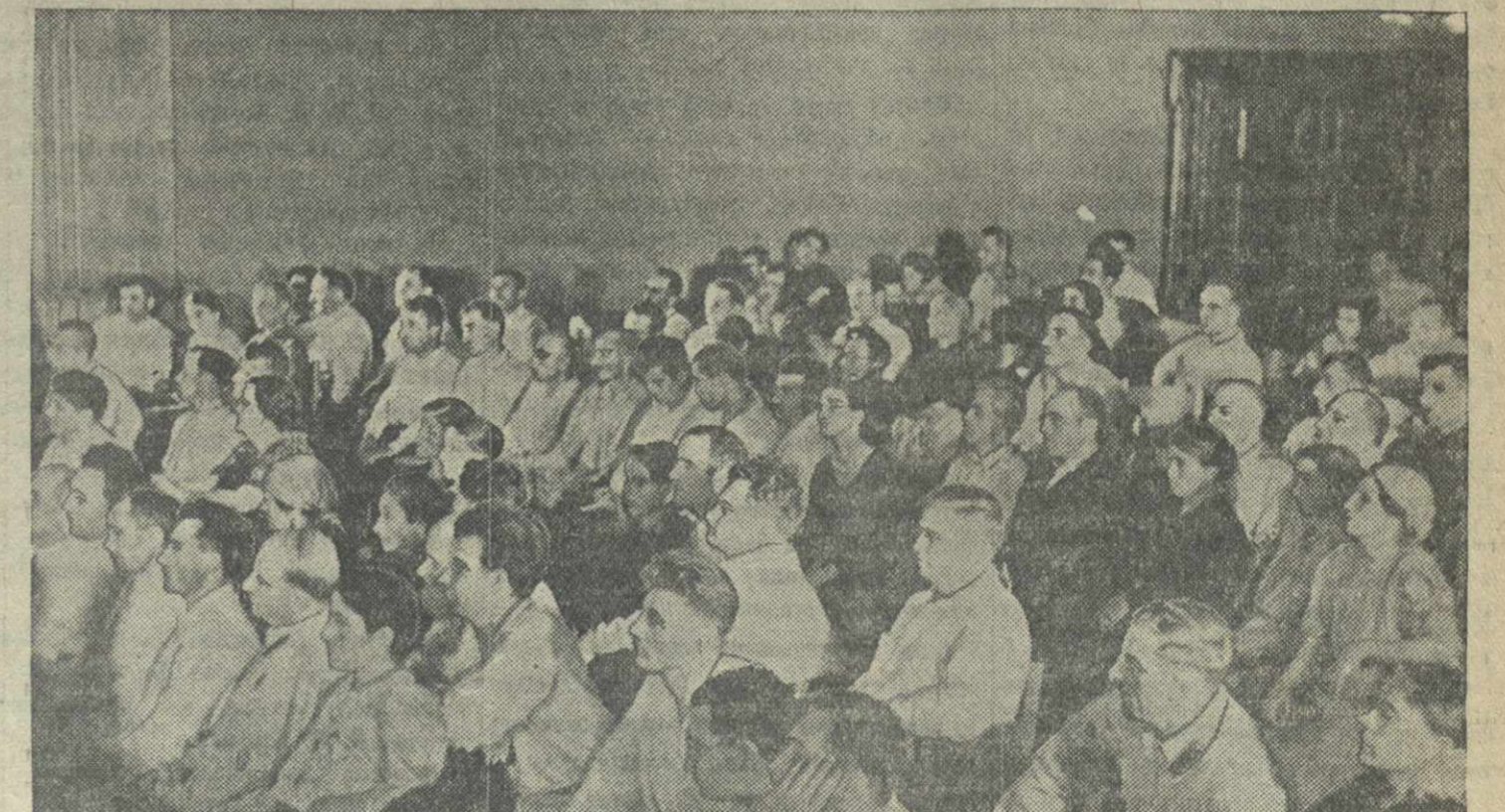
В зале заседаний первой Сессии Верховного Совета Грузинской ССР.

МАХАЧ-БАЛА, 8. (ТАСС). Президиум Центрального Исполнительного Комитета Дагестанской АССР постановил созвать первую сессию Верховного Совета Дагестанской Автономной Советской Социалистической Республики 26 июля 1938 года в гор. Махач-Бала.