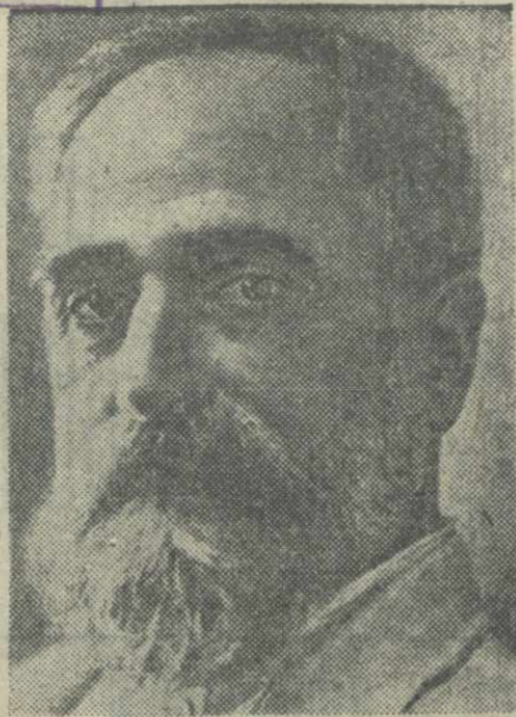
Председатель Президиума Верховного Совета Грузинской ССР МАХАРАДЗЕ Ф. Е.