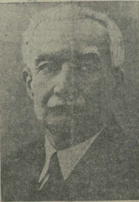
И. А. Джавахишвили