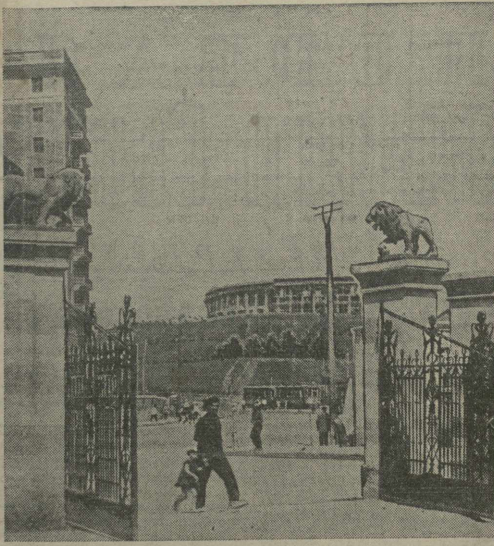
На площади им. Челюскинцев у входа в Тбилисский зоопарк. На заднем плане — строительство нового здания госцирка.

Исторический пример народов Советского Союза воодушевляет китайский народ на борьбу с японскими захватчиками.