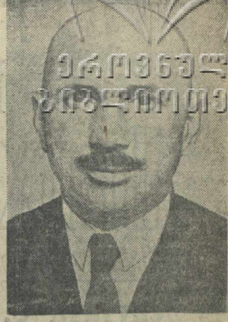
Секретарь Президиума Верховного Совета Грузинской ССР ЗГНАТАШВИЛИ В. Я.