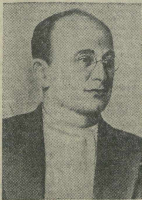
Л. П. Берия