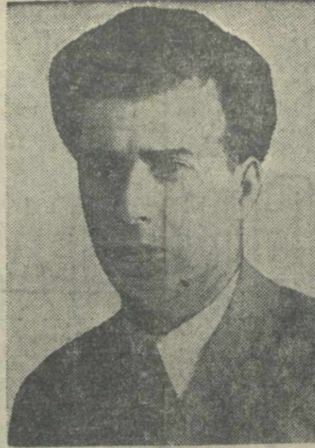
Заместитель Председателя Президиума Верховного Совета Грузинской ССР ДЕЛБА М. К.