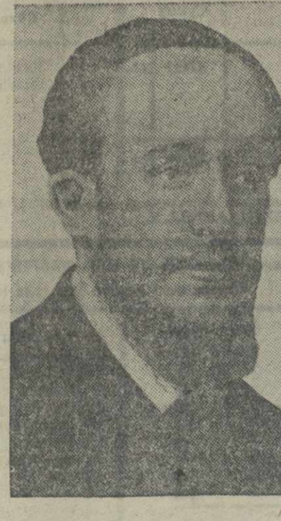
Он проводит в психиатрической больнице.

Наша парторганизация имеет значительный опыт политической работы среди беспартийных, накопленный в процессе подготовки к выборам в Верховный Совет Грузинской ССР. Для закрепления этого опыта наш партком собрал агитаторов, работавших на избирательных участках, проинструктировал их, выработал план дальнейшей работы.