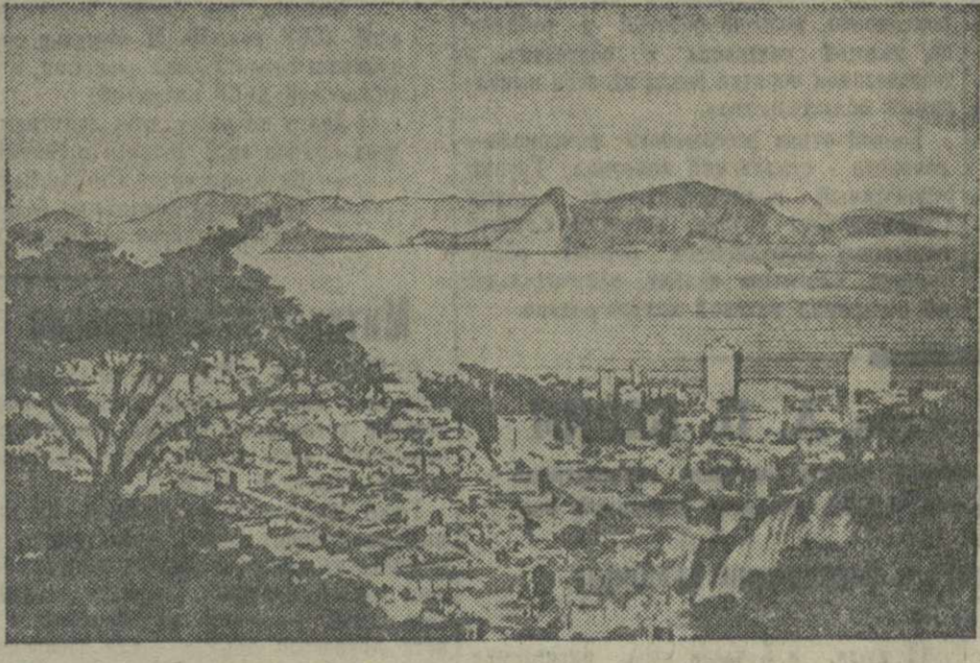
Вид портового города Амэй в Китае.