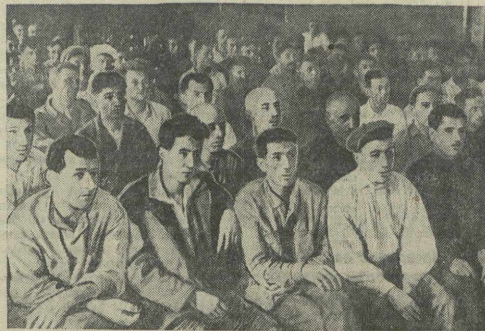
Партийное собрание на заводе им. 26 комиссаров, посвященное обсуждению итогов XI съезда КП(б) Грузии.