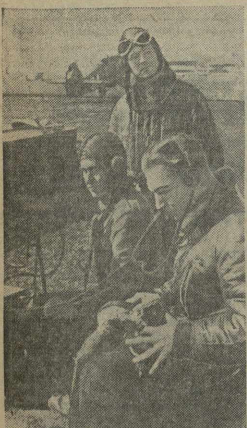
Маневры чехословацкой армии. На снимке: на аэродроме в Братиславе командир эскадрильи принимает распоряжение по радио.