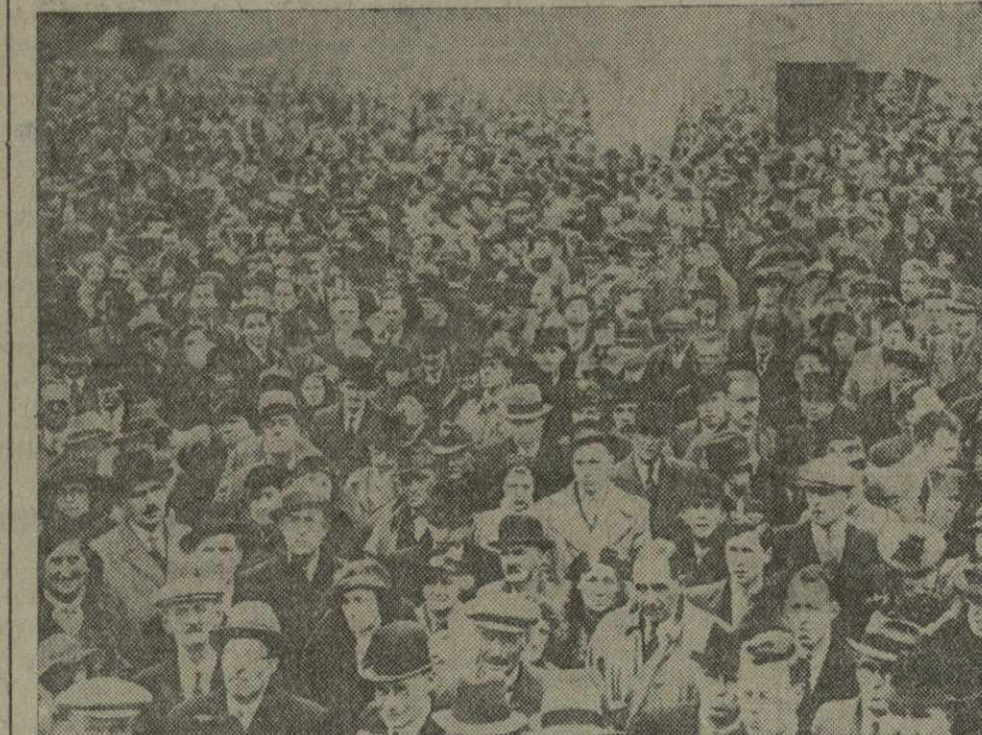
В Лондоне состоялась многотысячная демонстрация в защиту республиканской Испании. Демонстранты требовали беспрепятственной продажи оружия испанскому правительству. На снимке: митинг демонстрантов в Гайд-Парке.