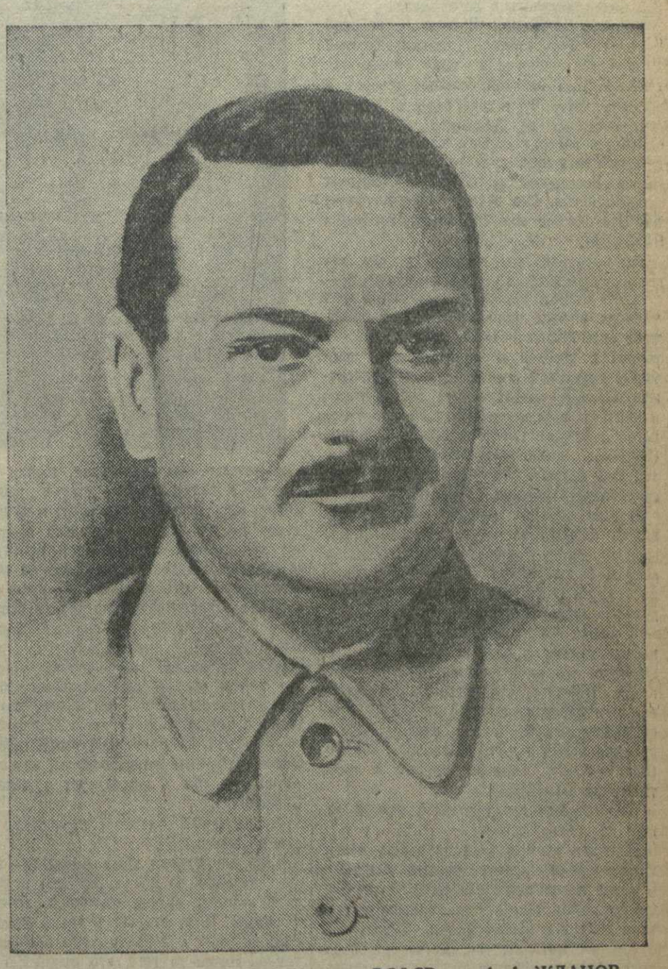
Председатель Верховного Совета РСФСР тов. А. А. ЖДАНОВ.