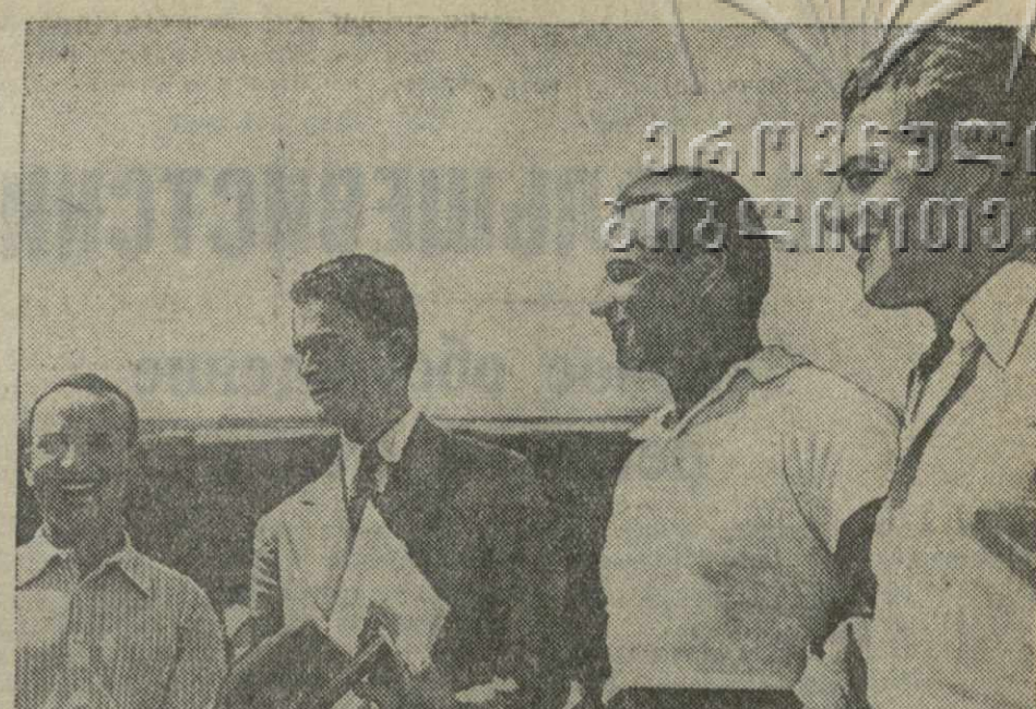
Американский летчик Говард Юз, совершивший кругосветный перелет на самолете «Лохид-14» — в Москве. На снимке (справа налево): Герои Советского Союза А. Б. Юмашев и М. М. Громов, Говард Юз и Герой Советского Союза Г. Ф. Байдуков на Московском центральном аэродроме.

ПАРИЖ, 15. (ТАСС). Так же как и в Париже, вчера в провинциальных городах всей Франции состоялись мощные демонстрации народного фронта. По сведениям «Юманите», в демонстрациях участвовало: в Лионе — 50 тыс. человек, в Тулузе — 20 тыс., в Марселе — 10 тыс. Многотысячные демонстрации состоялись также в Тулоне, Руане, Бордо, Гренобле, Перпиньяне и во многих других городах. Демонстрации прошли под лозунгами: «Откройте границу с республиканской Испанией». «Да здравствует единый фронт». «На защиту социальных законов». «За проведение в жизнь программы народного фронта» и т. д. Повсюду демонстрации выливались в величественные шествия трудящихся масс, объединенных антифашистским народным фронтом. Реакционная печать, которая в течение долгого времени преследовала ослабление народного фронта, сегодня обескуражено хранит молчание по поводу этих мощных демонстраций народного фронта.