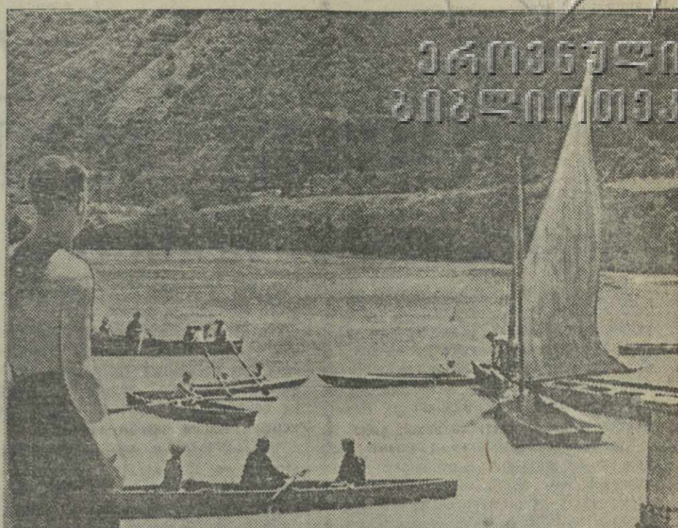
Водная станция в Мцхета. Катание на лодках. (Фото В. Столярова—Союзфото).