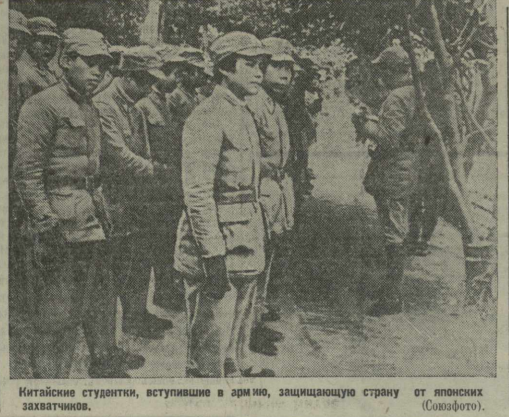
Китайские студентки, вступившие в армию, защищающую страну от японских захватчиков.