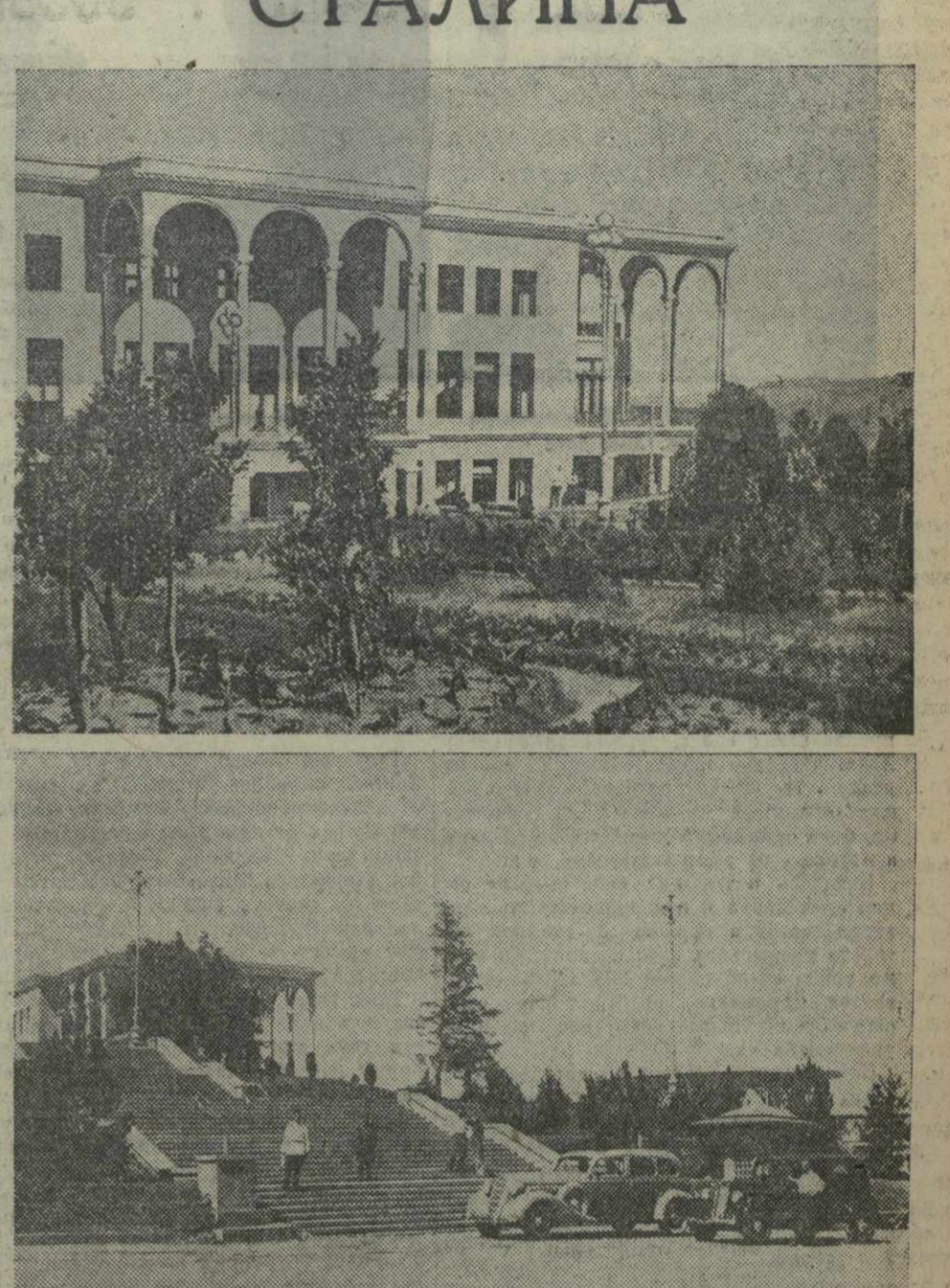
Парк имени СТАЛИНА на плато фуникулера. Сверху — здание станции, внизу — лестница, ведущая в парк от площадки для стоянки автомашин

Президиум Тбилисского Совета принял постановление привести парк культуры и отдыха на плато фуникулера имя товарища Сталина. Сейчас на плато заканчиваются последние работы, 24 июля загорится яркими огнями многочисленные лампы, защитят фонари.