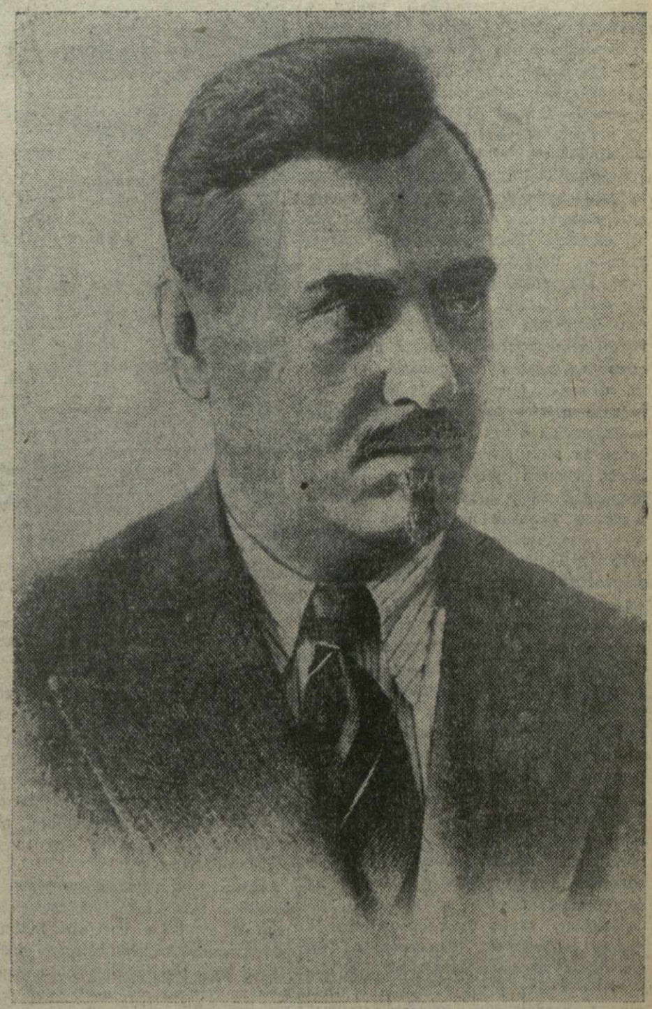
Председатель Совета Народных Комиссаров РСФСР тов. Н. А. Булганин