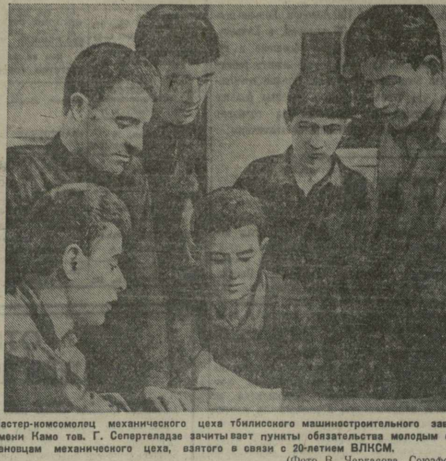
Мастер-комсомолец механического цеха тбилисского машиностроительного завода имени Камо тов. Г. Сепертедзе зачитывает пункты обязательства молодым стахановцам механического цеха, взятого в связи с 20-летием ВЛКСМ. (Фото В. Черкасова. Союзфото).

Н. АНОПОВА, мастерица Тбилисской табачной фабрики.