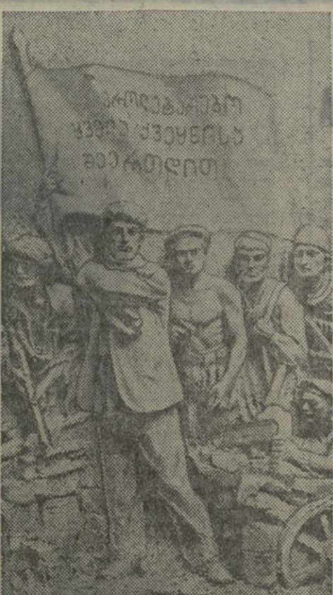
«Великий Сталин — основоположник большевистских организаций в Грузии и на Кавказе».

Огромную помощь в наших занятиях оказывает книга Л. П. Берия, которая с предельной ясностью рисует историю создания и укрепления большевистских организаций Грузии и Кавказа. Она показывает, как в беспощадной борьбе против меньшевиков, троцкистов и всяких иных контрреволюционеров, врагов рабочего класса росла и крепла могучая партия пролетариата и выковывалась ее славные традиции. Книга увлекательно повествует о революционной деятельности товарища Сталина, с именем кото-