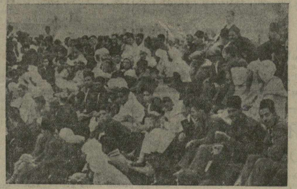
В Оране (Алжир) состоялся митинг солидарности с республиканской Испанией. На сцене: группа участников митинга.

В связи с этим Международный олимпийский комитет предложил Финляндии организовать олимпиаду 1940 г. Финляндия дала на это свое согласие. Местом устройства олимпиады избран г. Гельсинки.