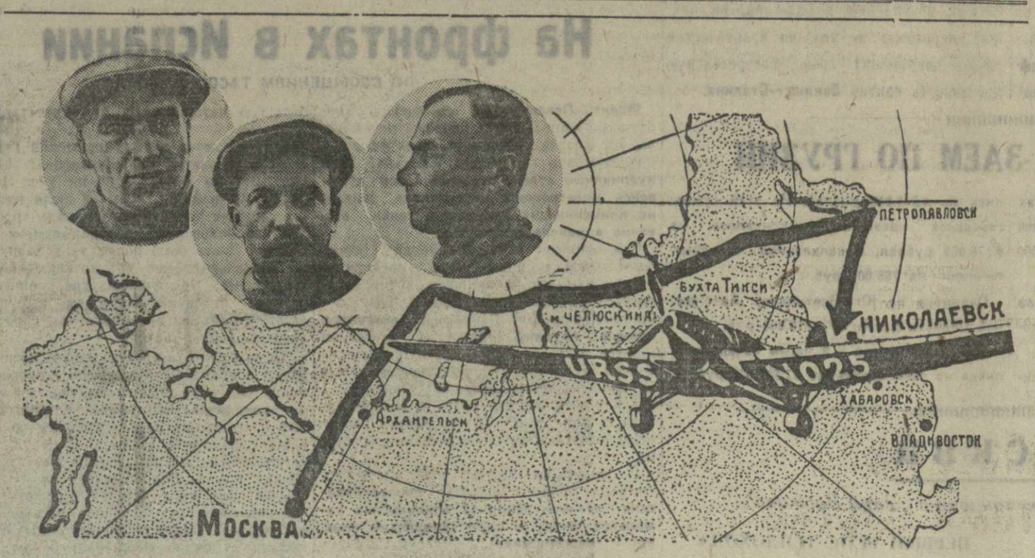
Схема героического беспосадочного дальнего перелета самолета «М-25». В воздушных — экипаж самолета — Герои Советского Союза В. П. Чкалов, Г. Ф. Байдуков и А. В. Белюков.

Миллионы глаз напряженно следили за полетом. Миллионы сердец билась вместе с сердцами отважных летчиков, безостановочно летевших по стальнойкой маршруту над морями и океаном, через степи, леса, горы и льды. Миллионы людей горячо поздравляли героев, открывших и завоевавших Великий Северный воздушный путь. Сталинские самолеты водтопили в