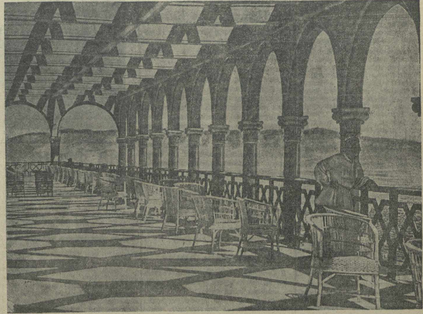
На веранде верхней станции фуникулера.

Входная плата в парк установлена в 50 коп., на эстраду — от 1 до 3 рублей, в кинотеатр — 50 коп.