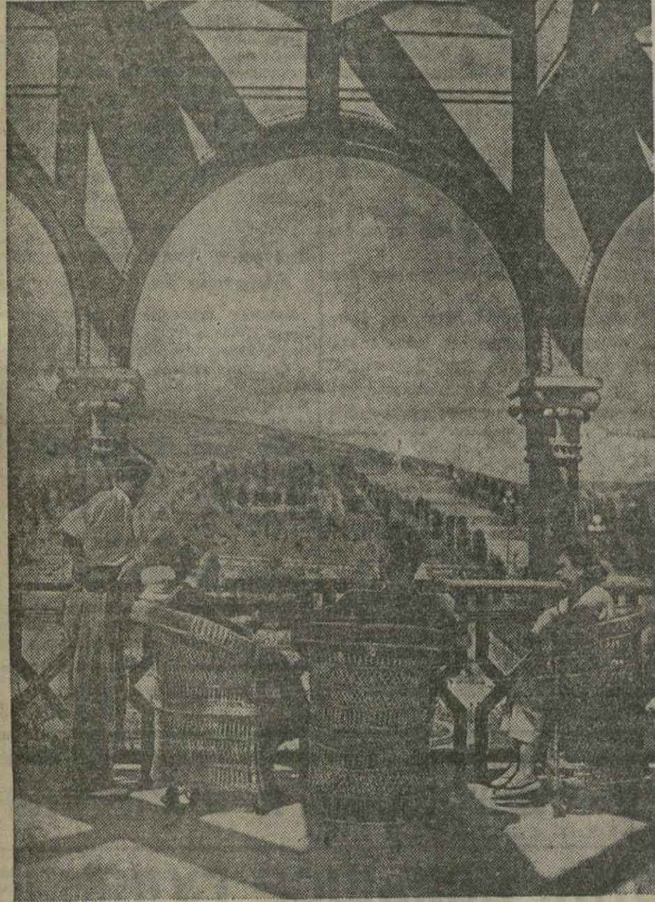
На верхней станции фуникулера.