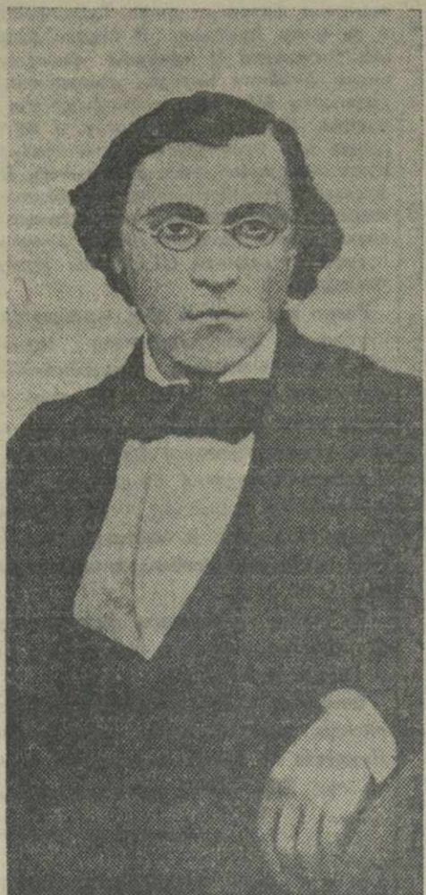
Только слишком полвека после этой позорной казни народ мог отомстить за это поругание над одним из лучших русских людей, крупнейшим ученым, мыслителем и пламенным, преданным народу социалистом домарковского периода. Погибли целые поколения революционеров в поисках настоящего пути. Этот путь найден был позже революционными марксистами. Но путь к революции прокладывали