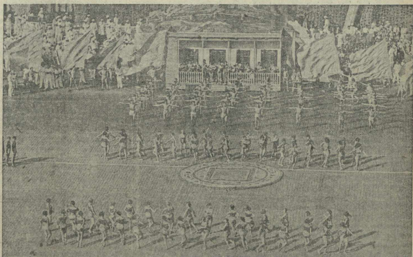
Всесоюзный физкультурный парад на Красной площади в Москве 24 июля 1938 года. На снимке: выступление физкультурников Грузии перед макетом дома, где родился и провел детство товарищ СТАЛИН.

Принято решение переименовать орган ЦИК Грузинской ССР газету «Коммунист» в орган Советов Депутатов Трудящихся Грузинской ССР.