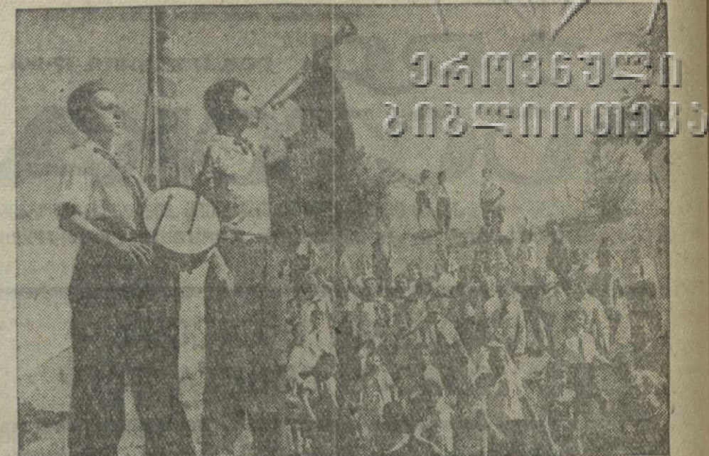
В подворном пионерском лагере.