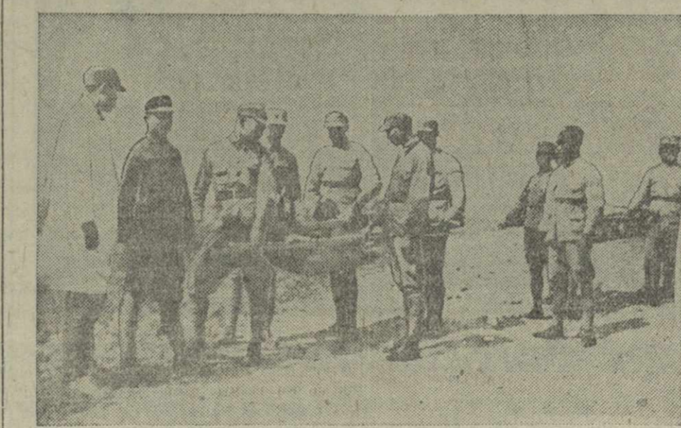
Санитарный отряд китайской армии на передовых позициях.

ИМРЕДИ и КАНЬЯ (венгерский министр иностранных дел) оказала возможность расширения англо-венгерского экономического сотрудничества и надежда на получение займа в Лондоне.