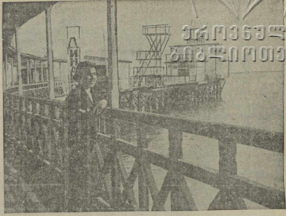
На водной станции «Динамо» в Сухуми.

ИМРЕДИ и КАНЬЯ (венгерский министр иностранных дел) оказала возможность расширения англо-венгерского экономического сотрудничества и надежда на получение займа в Лондоне.