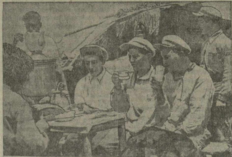
Комбайнеры Бердянской МТС во время перерыва в полевом стане колхоза имени Ильича сел. Кюртлар.

Полную безответственность проявили в молотбе правления Чочетского, Земоахалцигского и Ховлейского колхозов. До последнего времени здесь не подготовлены токи, в томах не подвезены снопы, в молотилках не прикреплены бригады и т. п.