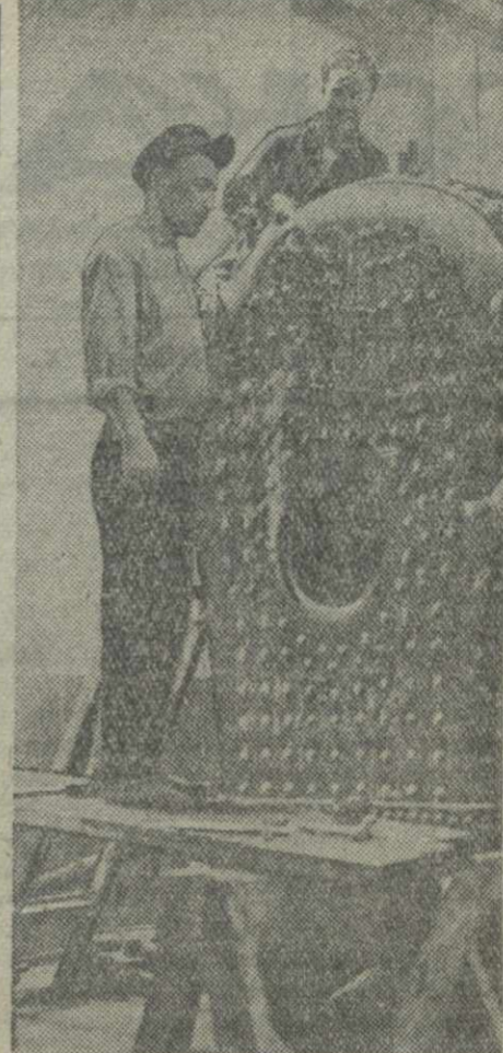
Бригада котельного цеха паровозово-агрегатного завода им. СТАЛИНА на Дню железнодорожника обвязала вывешенные котлы проволокой...