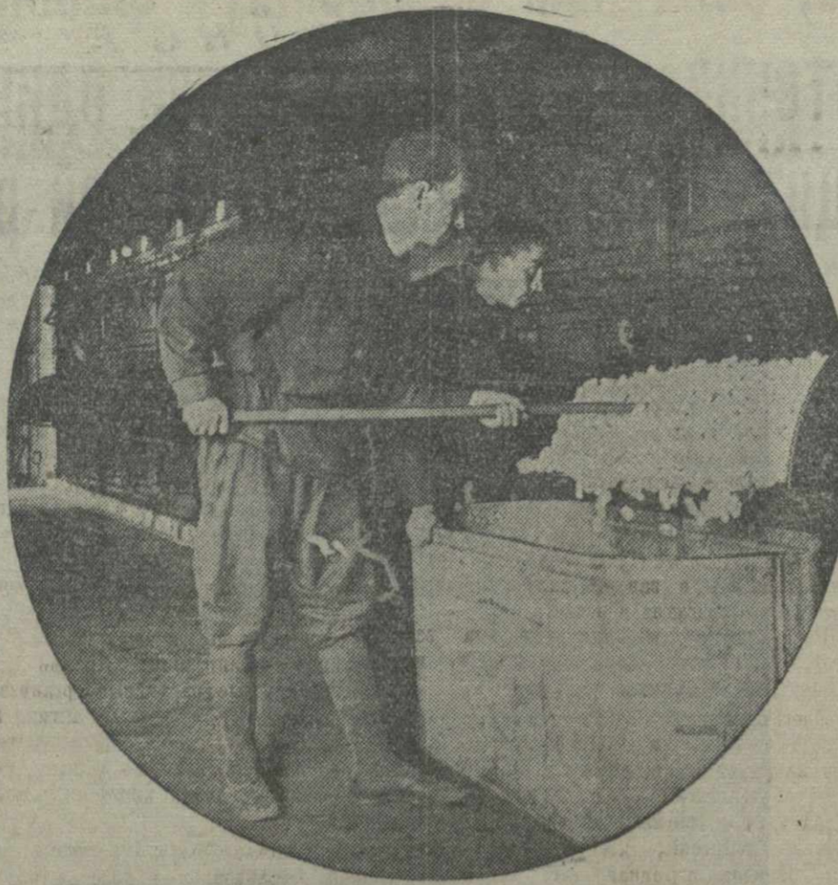
Зудидская шелкоткальная фабрика. Работа у коконосушильной печи.