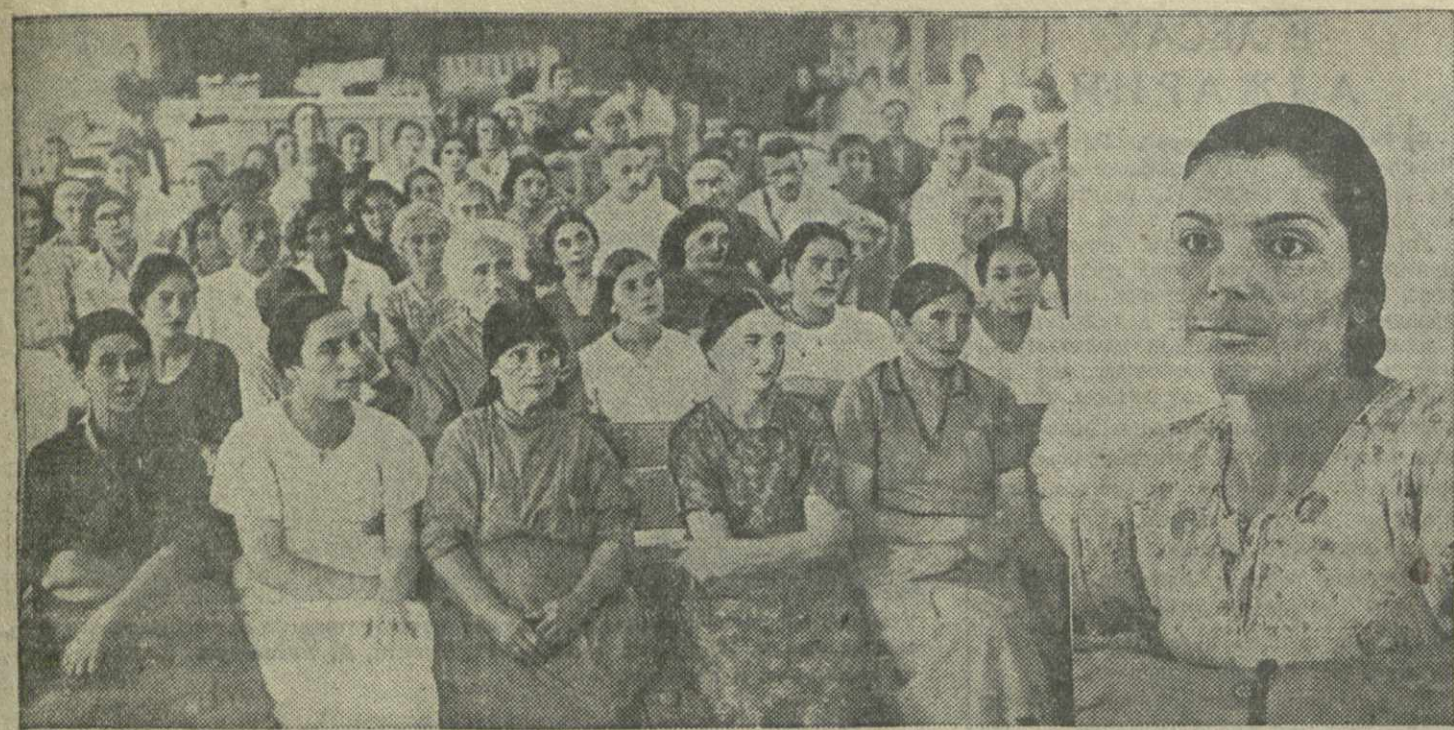
Групповое занятие сочувствующих и кандидатов партии по вопросам устава ВКП(б) на Тбилисской швейной фабрике Иккеран № 2. Справа — кандидат партии тов. Д. Исханян выступает с докладом на тему: «Обязанности члена партии».