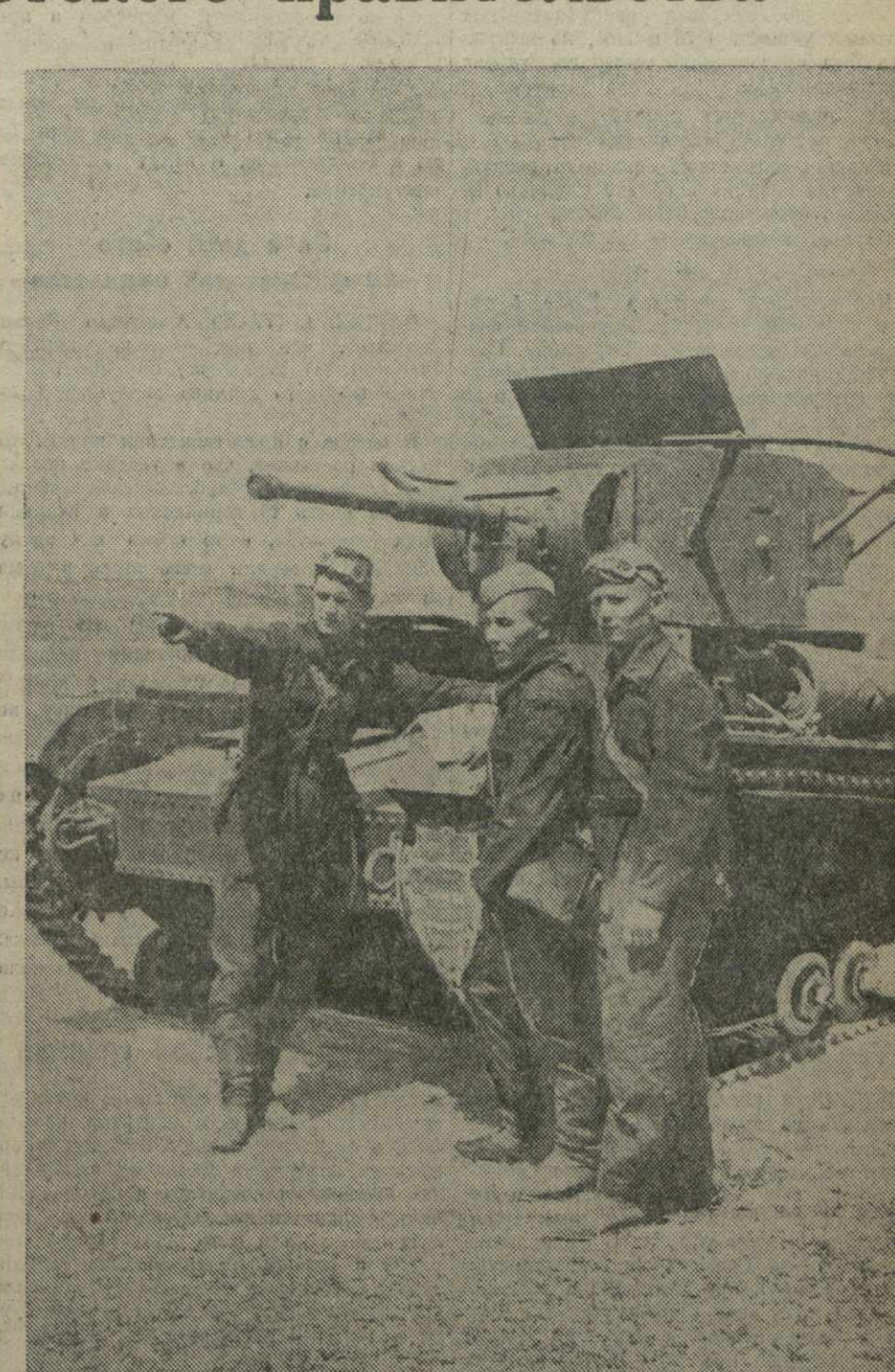
Таннисты Н части на тактических учениях.

Китайские газеты публикуют на видном месте телеграмму ТАСС о вторжении японских войск на советскую территорию. Газета «Синьхуажяо» в передовой статье пишет: «Причинами японской провокации являются: стремление японской военщины поднять патристический дух в Японии, возбудить на решимость китайского народа вести национальную войну, дать поражение и японским элементам квантунской армии (японская оккупационная армия в Маньчжурии) со стороны Красной Армии оказать влияние на дело мира во всем мире».