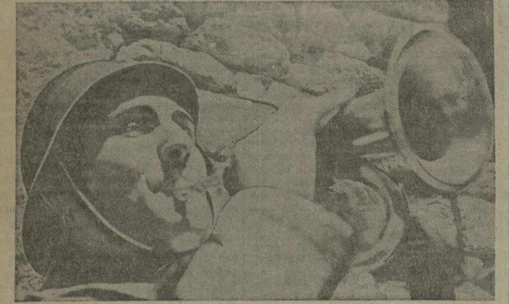
Горнист испанской республиканской армии.

Растут ряды Осоавиахима. Только за последние месяцы по Москве вступило в ряды общества свыше 60 тыс. человек.