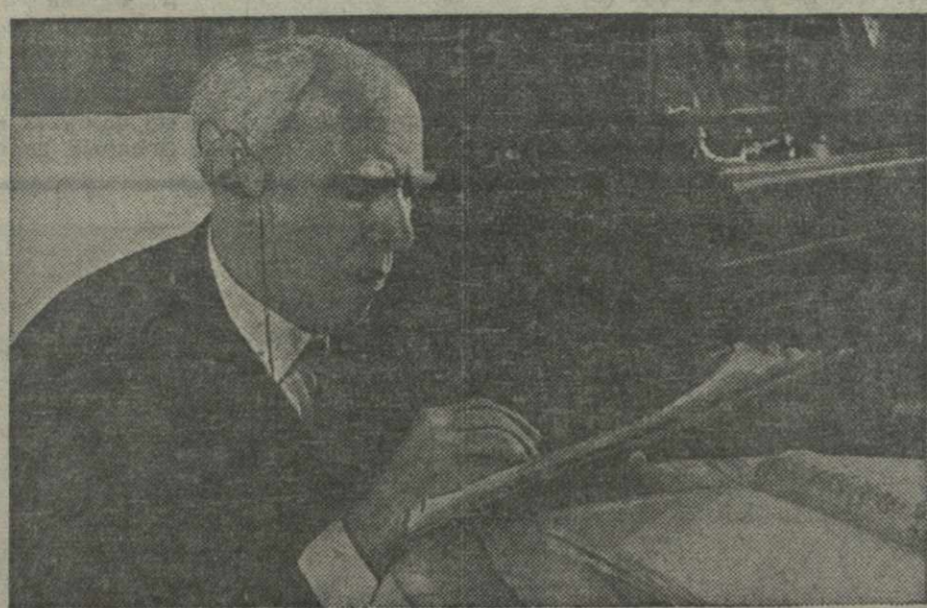
К. С. Станиславский в своем рабочем кабинете.

Достойный сын великого русского народа, Константин Сергеевич Станиславский положил немало сил для умножения славы своей прерванной родины, для умножения славы нашего театра. Этот гениальный мастер оценочного искусства с любовью выращивал молодых актеров, передавал свой богатый опыт старым мастерам. Образовавшийся человек нашего времени он до самой кончины не прекращал учиться и творить, порождая замыслы один прекраснее другого. Подобно именам Шопкина, Бартыгина, Ермоловой, имя Константина Станиславского золотыми буквами вписано в историю театрального искусства. М. ВОДОПЬАНОВ, Герой Советского Союза.