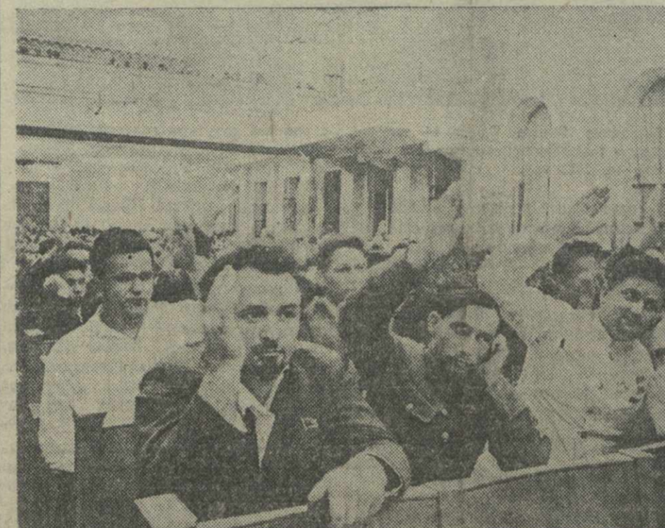
Вторая сессия Верховного Совета СССР. Заседание Совета Национальностей 14 августа. Голосование проекта закона о едином государственном бюджете Союза Советских Социалистических Республик на 1938 год.

Вчера, 21 августа, в 11 часов дня, в зале заседаний Верховного Совета СССР, в Кремле, состоялось восьмое заседание Совета Союза.