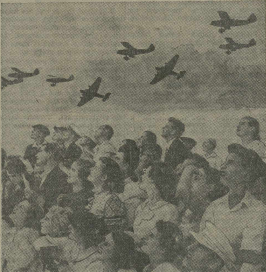
18 августа, в Москве на аэродроме Центрального аэроклуба им. Носарева в Тушине состоялся праздник, посвященный Дню авиации. На снимке: зрители наблюдают за полетом самолета.