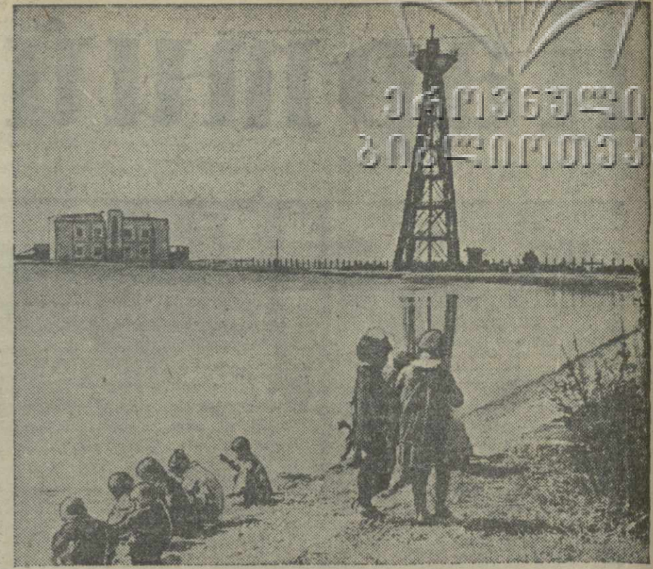
Детский парк культуры и отдыха в Батуми. Дети на берегу озера.