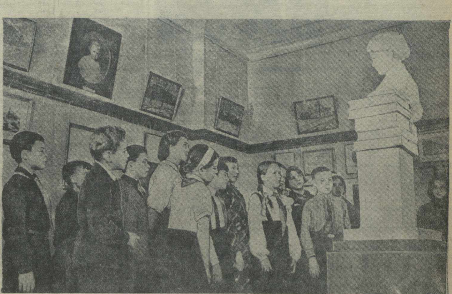
Экскурсия учащихся в Центральном музее В. И. Ленина в Москве.