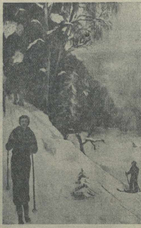
«Лыжники». Картина В. А. Кононова.

В фойе концертного зала будут выставлены материалы, посвященные жизни и творчеству М. М. Ипполитова-Иванова.