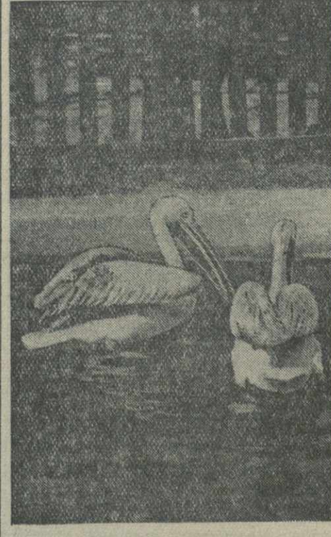
Пеликаны в зоопарке.

Постройка бани должна быть закончена во втором квартале этого года.