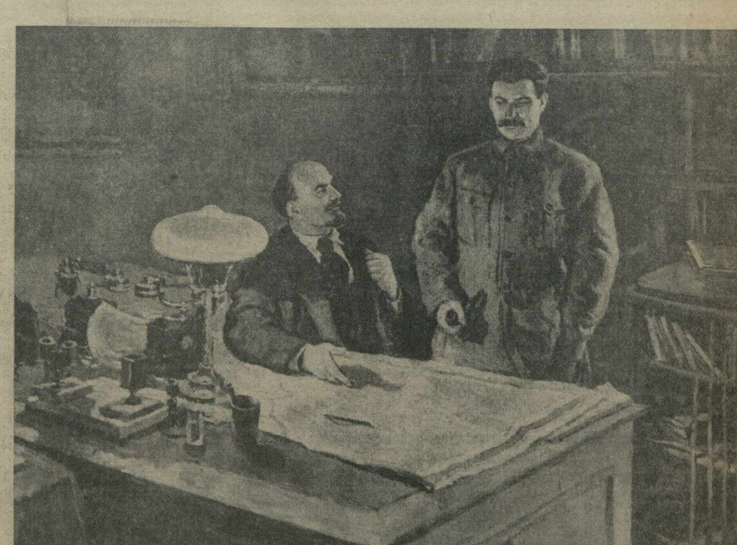
В Государственной Третьяковской галерее (Москва) открылась художественная выставка «СТАЛИН и люди сталинской эпохи».

По решению секретариата ВЦСПС для победителей первенства профсоюзов по отдельным видам спорта учреждены переходящие призы и вымпелы.