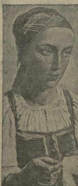
Худ. А. Г. Венецианов — «Храстинская девушка за вышиванием» (1843 г.) (из экспонатов выставки Третьяковской галереи в Тбилиси).

Несмотря на более чем столетнюю давность, альбом находится в хорошей сохранности. Он заключен в красивый сафьяновый переплет с серебряной застежкой и накладкой.