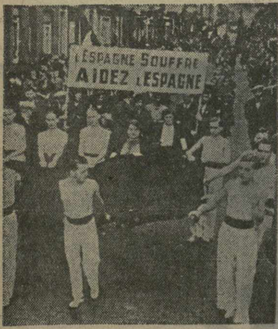
Демонстрация объединенной социалистической молодежи в Брюсселе под лозунгом борьбы против фашизма и защиты республиканской Испании. На снимке: сбор средств в пользу республиканской Испании. На плакате лозунг: «Испания отрадает. Помогите Испании».