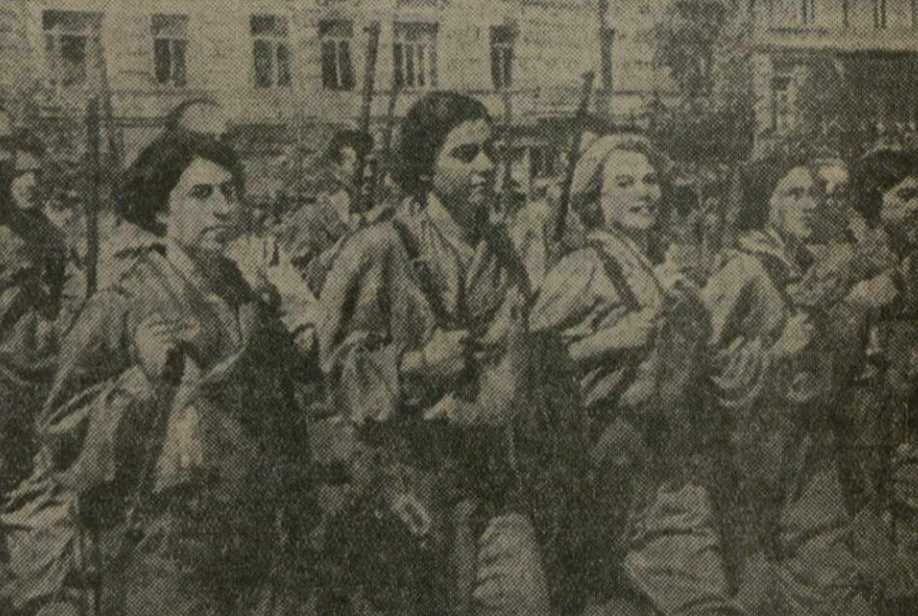
Ворошиловские стрелки клуба имени Нариманова в колонне Кировского района.

В демонстрации приняло участие свыше 120 тысяч человек.