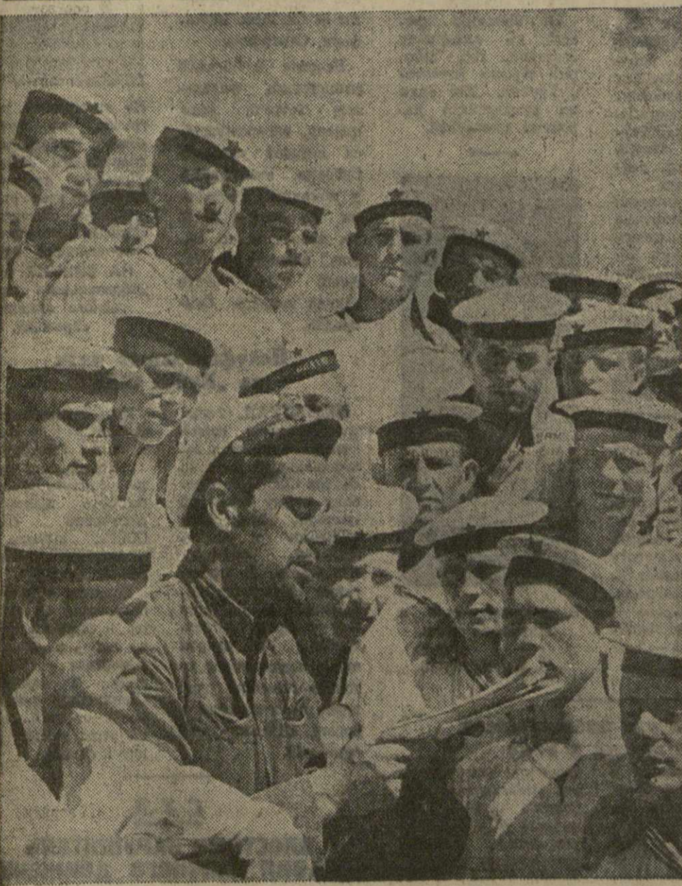
Подготовленные для службы в Военно-Морском Флоте призывники Сталинградского учебного пункта слушают политинформацию.

Можно в залах у картин и скульптур можно ежедневно видеть примыников столицы, уходивших на службу в ряды РККА и Военно-Морского Флота.