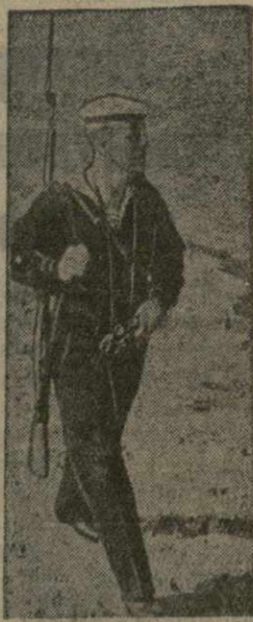
На страже морских границ. Краснофлотцы в дозоре.

Очевидцы рассказывают, что наибольшую ловкость обнаружил министр прессы и пропаганды Альфредо и главный секретарь фашистской партии Стараче. Жесты были сравнительно немногие. Один главарь местной организации фашистской партии обвел ногу, несколько человек поранили себя о штыки и одного немного помало тактом. 38 человек не выдержали испытаний и уже сняты со своих постов.