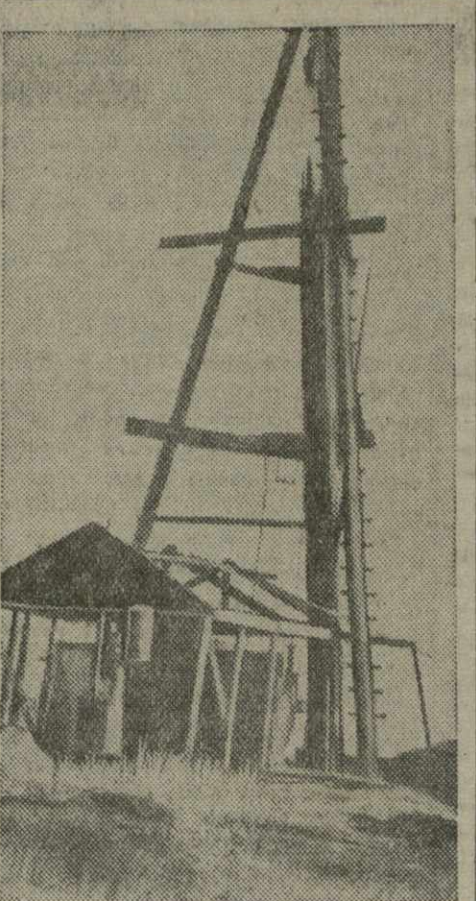
Крепильная скважина № 16, нефтеразведки Норно треста Грузнефти. 13 сентября из этой скважины ударил нефтяной фонтан. Скважина дала 130 тонн легкой высококачественной нефти.

Уверен, что при большевистской мобилизации всего коллектива работников Грузнефти и руководства объединения Азнефтедобычи и руководящей помощи ЦК КП(б) и правительства Грузии наша родина уже в этом году получит промышленную нефть из новых районов.