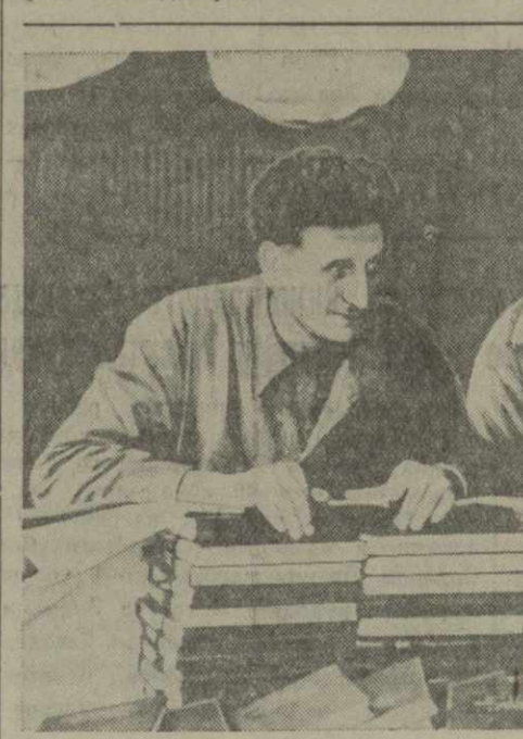
«Краткий курс истории ВКП(б)» переведен на французский язык. На снимке: упаковка книг в Париже для рассылки в различные районы Франции.

ПАРИЖ, 12. (ТАСС). 10 июня докеры Руана, поддержанные моряками и другими портовыми рабочими, объявили забастовку в знак протеста против притеснений рабочих со стороны предпринимателей и нарушений последними коллективного договора. Рабочие потребовали, чтобы предприниматели отказались от найма фашистских провокаторов, принадлежащих к желтым профсоюзам. Предприниматели вынуждены были удовлетворить требования докеров.