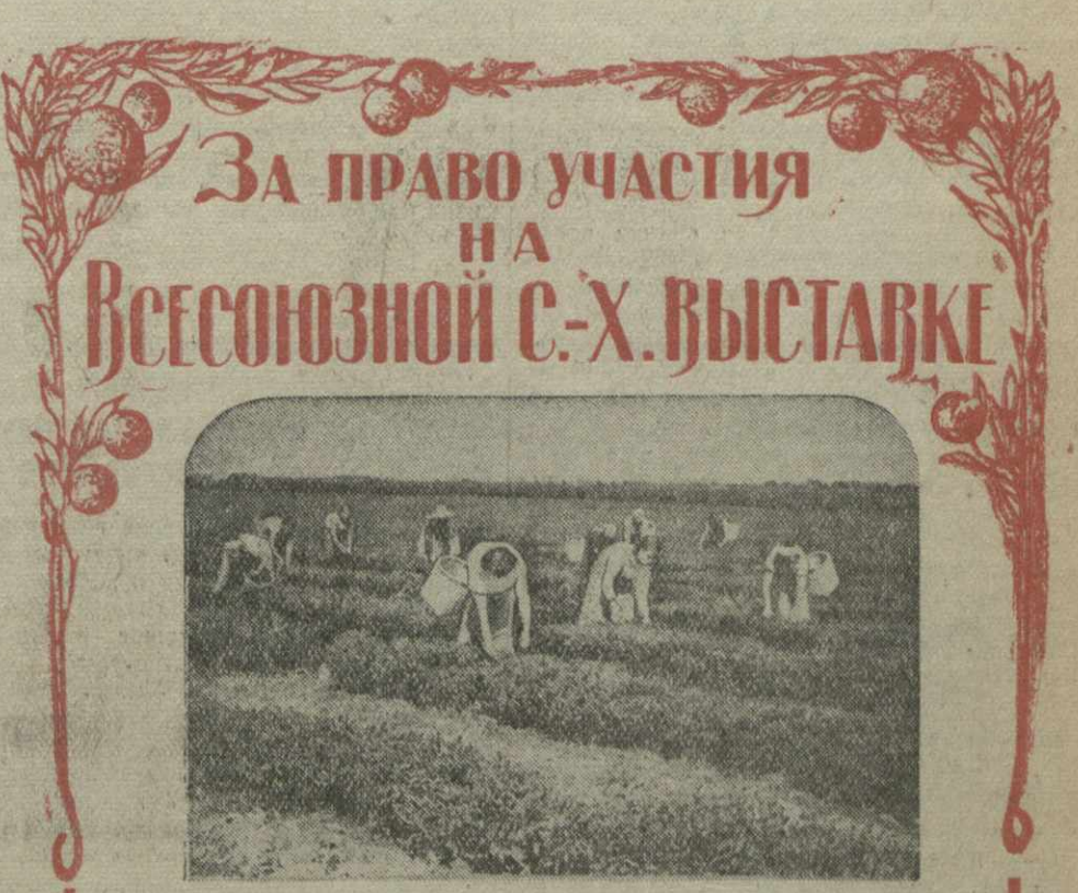
Вулланд. Сбор чайного листа на плантациях Джугельянского совхоза — кандидата на участие на Всесоюзной с.-х. выставке.