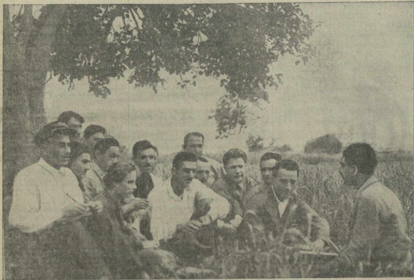
Занятие кружка по изучению истории партии в селении Кандаура.