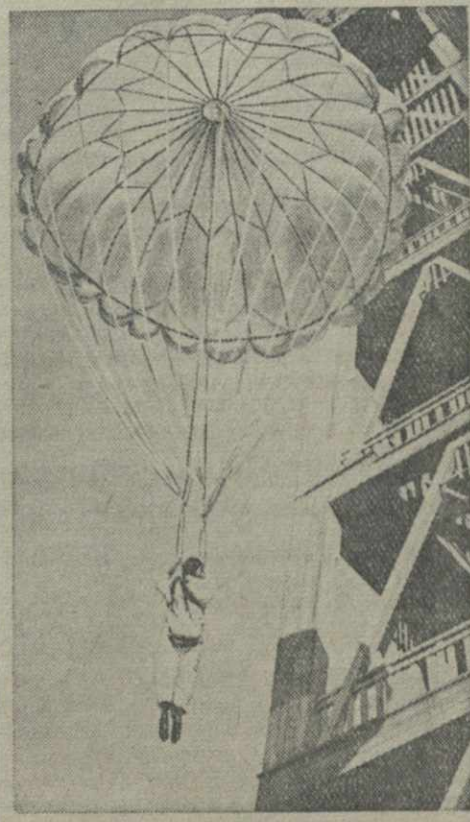
Прыжок с парашютной вышки в Саду имени коммунар.

Победители смотра выступают на республиканском смотре творчества молодых работников театра, который состоится в Москве.