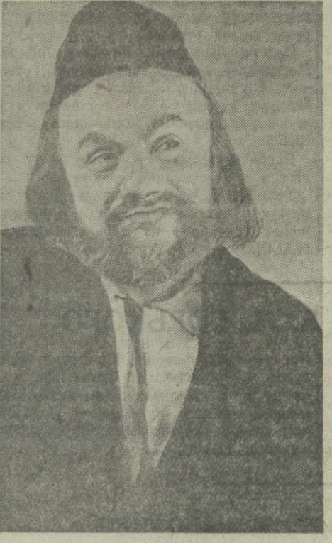
Заслуженный артист УССР М. Крушельницкий в роли дьяка Гаврилы.

Марьяненко дает спокойный и сдержанный, внутренне собранный образ народного вождя, лишь в редких вспышках темперамента раскрывающего глубоко чувствующего человека. Хорошо удаются артисту рисующие сложную душевную