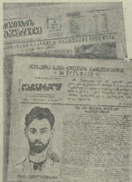
Номера районных газет «Чиатурис магарели» и «Дамиврели» с материалами по истории революционного движения в Грузии и на Кавказе.