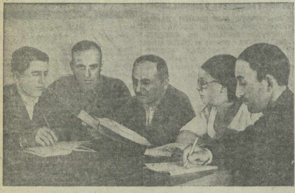
Занятия семинара линейных пропагандистов в парткабинете политотдела Тбилисского отделения Закавказской железной дороги.