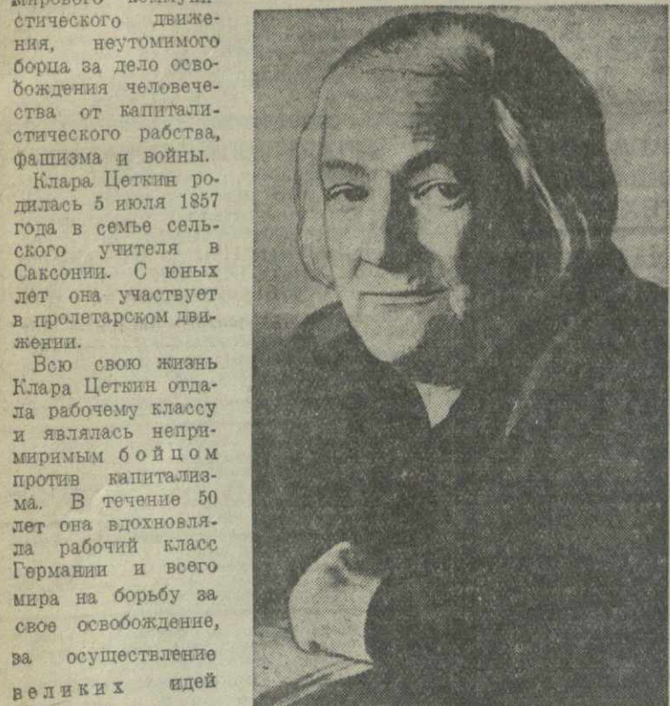
Клава Цеткин была руководителем социалистического женского движения. По ее инициативе в 1910 г. было принято постановление о ежегодном проведении международного женского дня, ставшего с того времени днем мобилизации рабочих и крестьянок на борьбу против капиталистического строя.

В дальнейшем жизнь Клавы Цеткин была неразрывно связана с великим де- лом, которым руководит партия Ленина—Сталина. Она стояла у колыбели германской компартии, она помогала германским рабочим освободиться от социал-демократических заблуждений и стать на путь революционной борьбы.