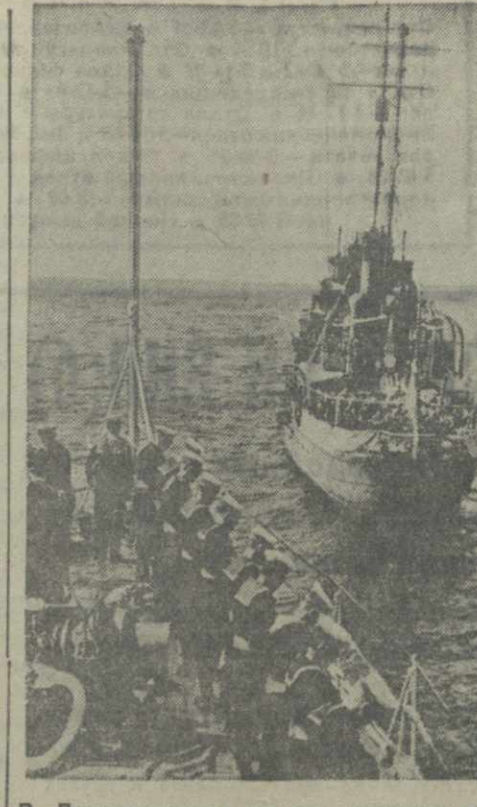
В Ливерпульском заливе затонула английская подводная лодка «Тэтио». На борту лодки находилось 103 человека, из них 99 человек погибли. На снимке: оттопыренный английский парадокс «Чайка» оттопырил на месте катастрофы последний долг погибшим товарищам.

Японская печать настаивает на принятии более строгих мер в отношении английской концессии в Тяньцзине. Газета японской воюющей «Сингунбао» заявляет, что скоро временное «правительство» возьмет в свои руки английскую концессию в Тяньцзине.