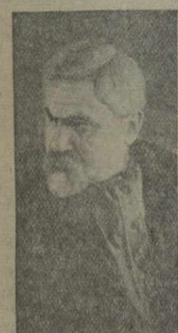
Заслуженный артист УССР И. Марьяненко в роли Кузьмы Рыжова.

Эта органическая целостность спектакля, его внутренняя дисциплинированность — большая удача постановщика заслуженного артиста УССР М. М. Крушельницкого. Постановщик сумел преодолеть главный недостаток пьесы Корнейчука — ее фрагментарность, разрозненность на отдельные эпизоды, иногда слабо связанные друг с другом.