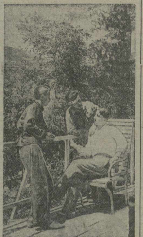
На площадке отдыха в Парке имени С. Орджоникидзе.

В Восточную Грузию выезжает бригада артистов Грузинской государственной эстрады в составе 12 человек. Бригада будет выступать в районных центрах, в крупных колхозах и совхозах.