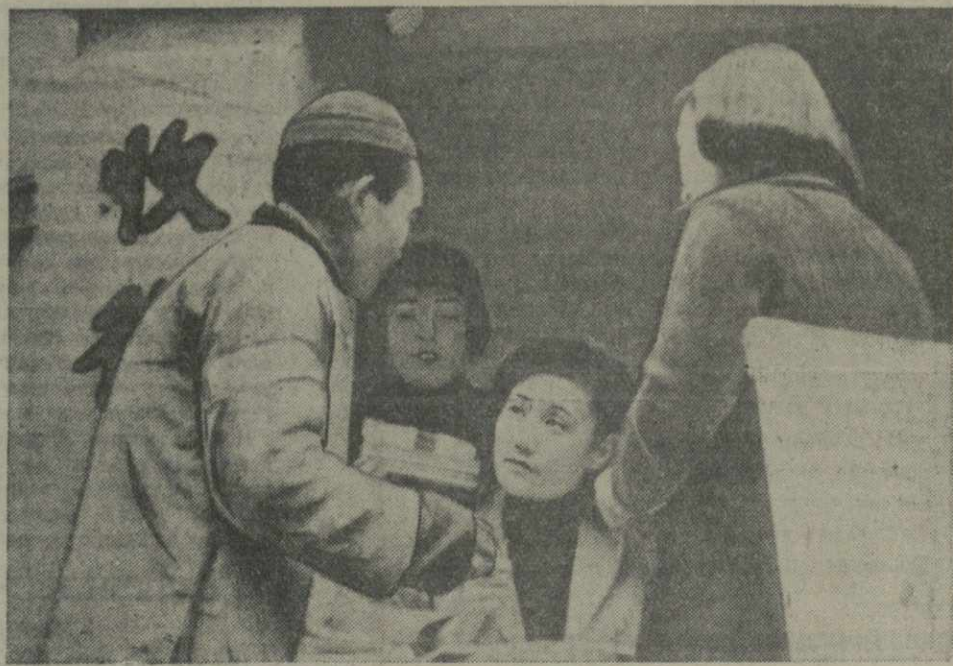
В Чунцине китайские женщины организовали общество помощи семьям бойцов, сражающихся против японских захватчиков. На снимке: члены общества раздают подарки семьям бойцов китайской армии.

ЛОНДОН, 22. (ТАСС). Агентство Рейтер сообщает, что вчера из Баиняна и Шанхайгуаня в Тяньцзинь прибыла рота английской пехоты. Это вызвало там особую удовлетворения, поскольку, по словам, японцы намеряют усилить меры против английской концессии.