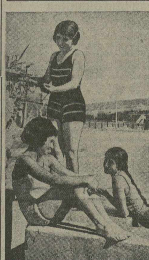
Студенты Тбилисского института физической культуры на водном бассейне.