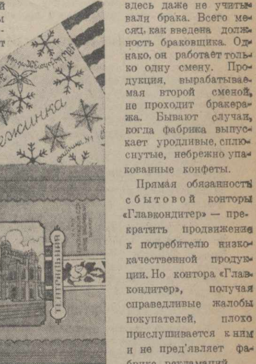
Этикетки конфет кондитерской фабрики № 1.

Продукция Тбилисской кондитерской фабрики № 1 можно встретить в любом магазине. «Карнавал», «Тбилиси», «Клос», «Монтана» и другие сорта конфет.