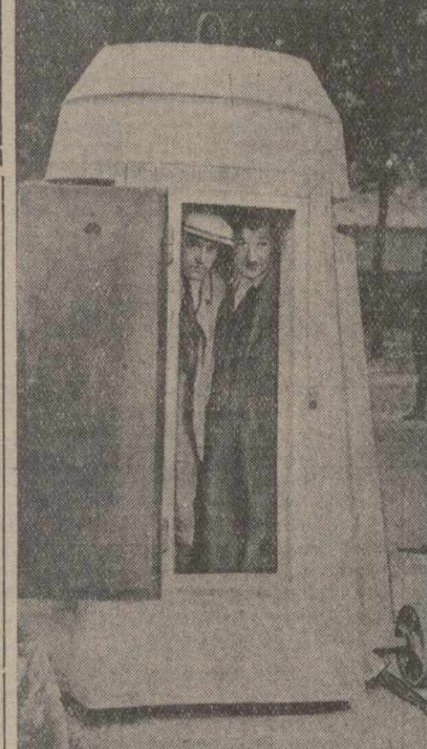
В Париже открылась французская неделя безопасности. На снимке: парадничное гаубубеище на улицах Парижа. Фотохроника ТАСС.