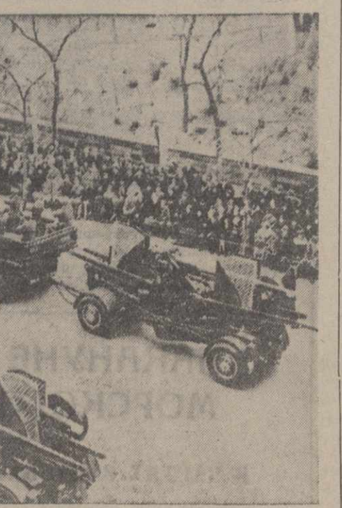
В Нью-Йорке состоялся военный парад. На снимке: прохождение зенитной артиллерии по улицам Нью-Йорка.

В середине июня словацкие студенты выгнали всех немцев из ресторана и кафе в Братиславе. Инциденты имеют место ежедневно. Словаки снова и повсюду настойчиво возвращаются к идее объединения Чехии и Словакии.