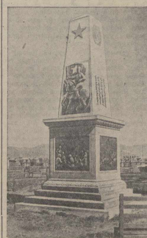
Памятник в столице Монгольской Народной Республики Улан-Баторе народному герою Суха-Батору.

Единственной и руководящей партией в МНР является монгольская народно-революционная партия. Эта партия и монгольское правительство определяют политический строй страны, как бур-