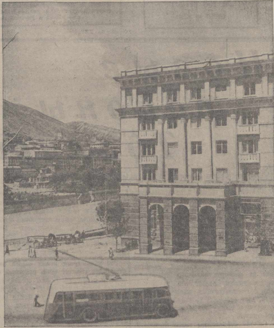
Тбилиси. На площади имени К. Маркса. (Район им. Молотова).