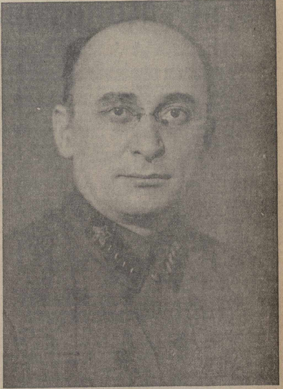
ЛАВРЕНТИЙ ПАВЛОВИЧ БЕРИЯ.

Товарищ Сталин в своем докладе на XVIII съезде ВКП(б) говорил: «Укрепление партии и ее руководящих органов осуществлялось за отчетный период в первую очередь по двум линиям: по линии реорганизации состава партии, вытеснения неадекватных и отбора лучших, и по линии разукрупнения организаций, уменьшения их размеров и приближения руководящих органов к низовой, оперативной, конкретной работе».