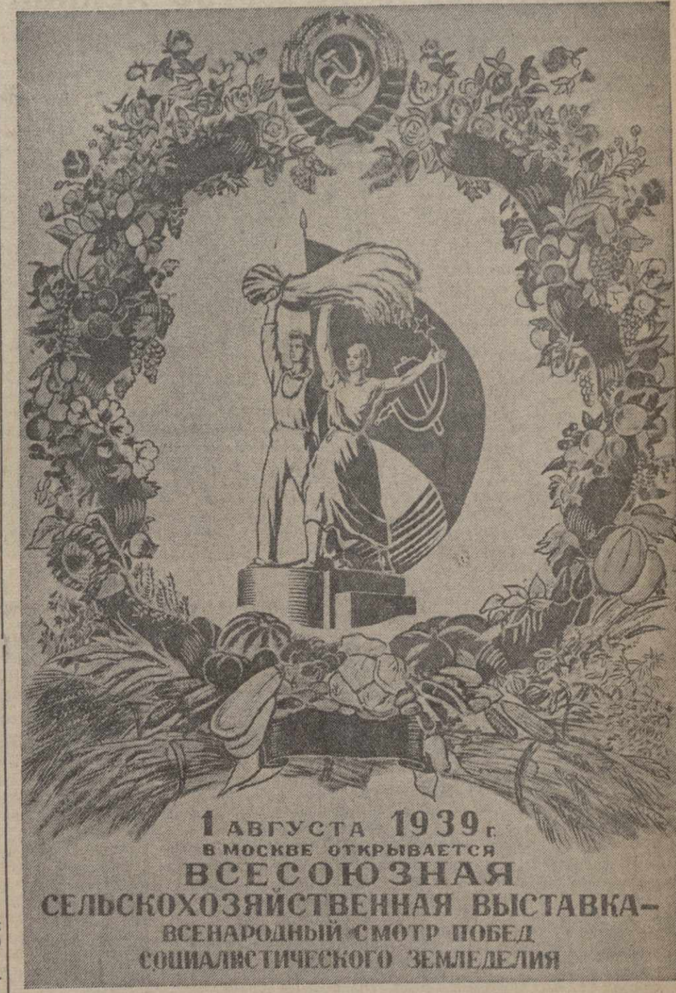
Планет художника В. Ливановой, выпущенный издательством «Искусство» к открытию Всесоюзной сельскохозяйственной выставки.

Митинг окончен. Под звуки траурной мелодии тела погибших опускаются в могилы. (ТА).