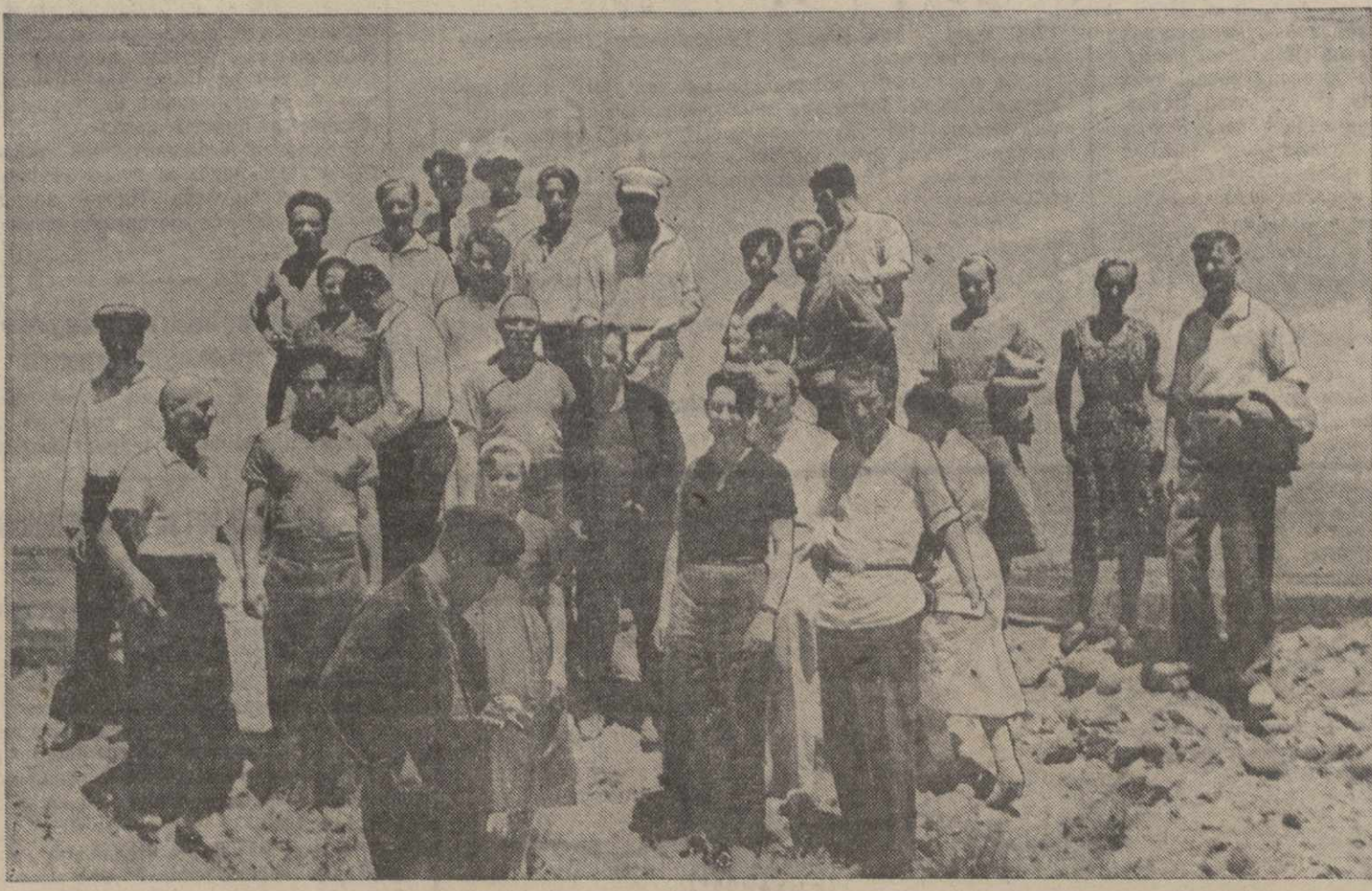
Группа артистов театра им. Шевченко на развалинах Горийской крепости.