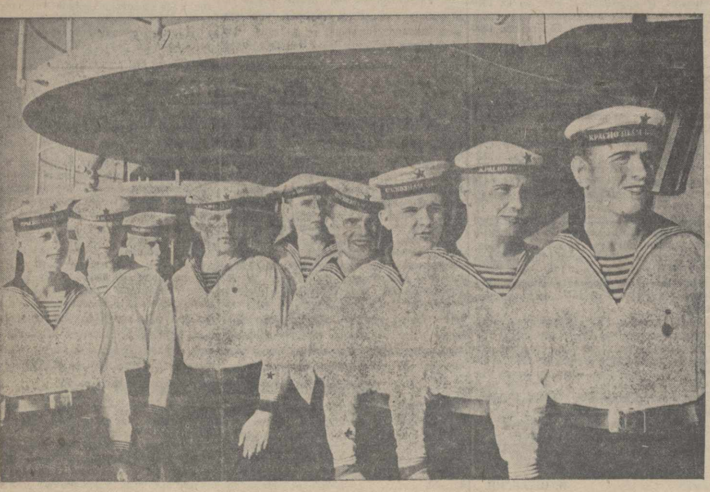
Младшие командиры и краснофлотцы Краснознаменного Балтийского Флота.

В течение трехдневного похода и во время различных маневрирования кораблей показали непоколебимую слаженность. На всех кораблях бесперебойно работали ме-