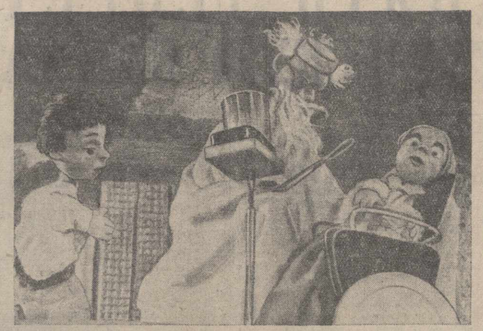
«Путешествие в странные страны» в Московском театре кукол.