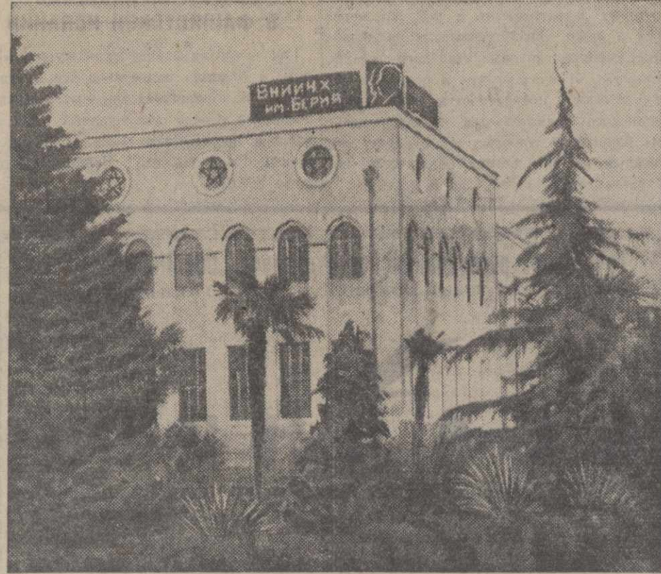
Здание Всесоюзного научно-исследовательского института чайного хозяйства имени Берия в Анасеули.

— Будем жить еще богаче и радостней, чем живем сейчас, — провозглашает он тост. — И пусть плоды нашего труда будут еще богаче и краше.