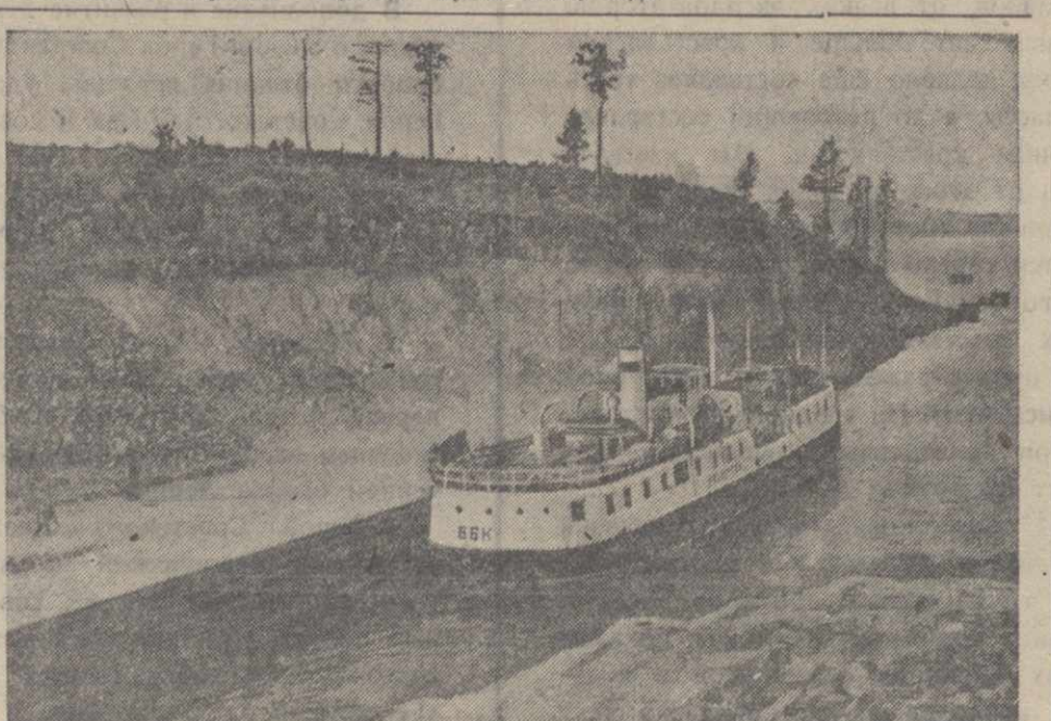
2 августа исполнилось 6 лет со дня постановления Совнаркома СССР об открытии Беломорско-Балтийского канала имени И. В. СТАЛИНА. На снимке: паролот „Нарл Марш“ подходит к шлюзу. Фотохроника ТАСС.

ЧКАЛОВ. 1. (ТАСС). На новой железнодорожной линии Орск—Домбаровские угли протяжением в 93 километра открылось рабочее движение. В связи с этим в Домбаровске состоялся 8-тысячный митинг, на котором была зачитана приветственная телеграмма наркома путей