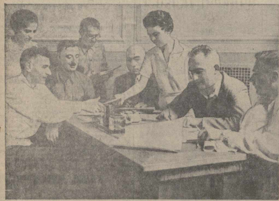
Профессора и преподаватели Грузинского индустриального института им. Кирова подписывают на заем.