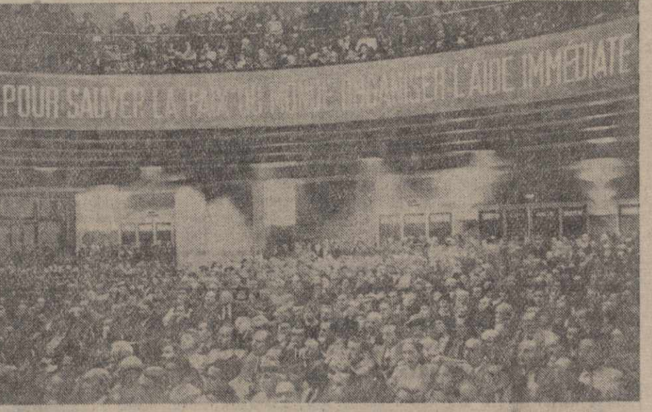
В Париже состоялась при участии нескольких тысяч человек конференция «Международного движения за мир». На снимке: общий вид зала заседания.

★ Численность английской регулярной и территориальной армий и их резервов увеличилась за время с 1 июля 1938 г. по 1 июля 1939 г. с 34.000 офицеров и 520.000 рядовых до 41.000 офицеров и 708.000 рядовых. (ТАСС).