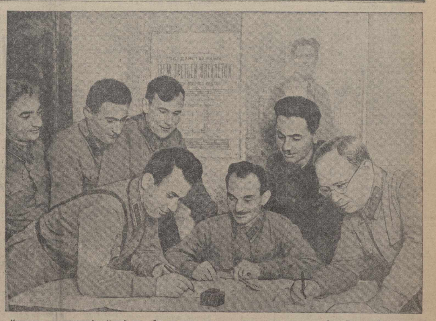
Командиры и красноармейцы N-ой части Закавказского военного округа подписываются на Заем Третьей Пятилетки (выпуск второго года).

ПЕРВАЯ ОТДЕЛЬНАЯ КРАСНОЗНАМЕННАЯ АРМИЯ, 2. (ТАСС). Боицы, командиры и политработники Первой Отдельной Краснознаменной армии встречают годовщину разгрома японских самураев в районе озера Хасан новыми успехами в боевой и политической подготовке.