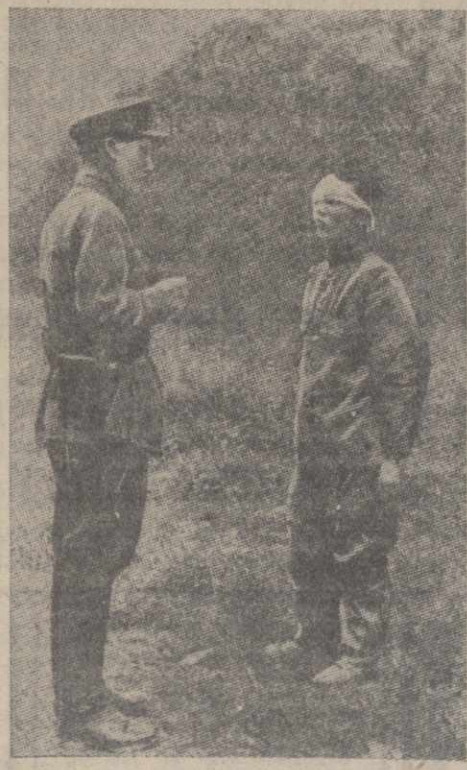
Допрос пленного японского солдата.