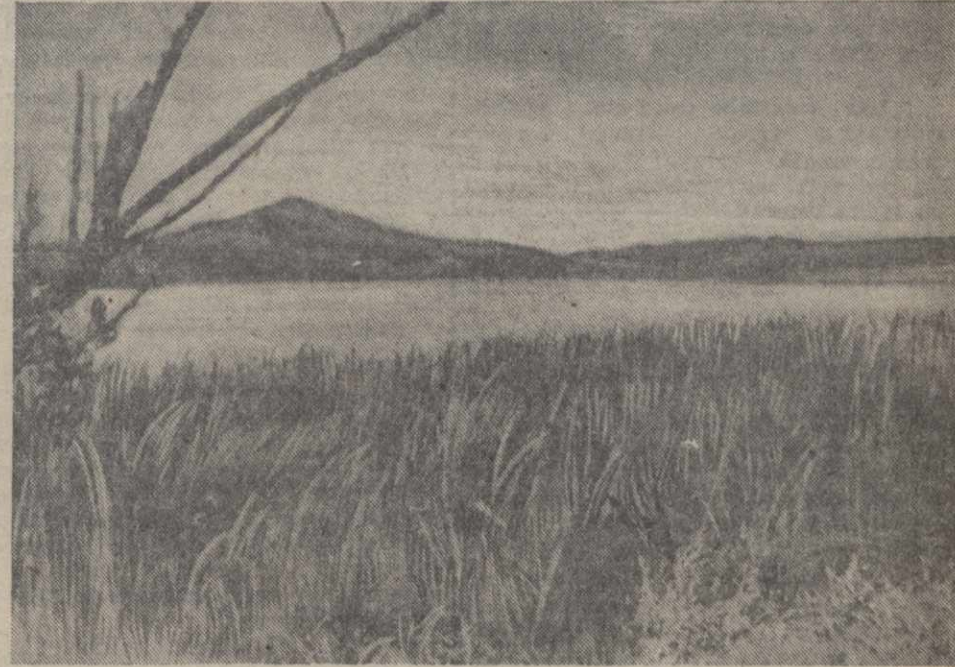
Озеро Хасан и сопка Заозерная.

Обе вражеские группы залегли в траве, не прекращая интенсивную стрельбу по нашему наряду под прикрытием огня ручных и станковых пулеметов. Выскользнула из-за вала третья группа японо-манчжур с дикими криками «банаба» бросилась на нас в атаку с фронта.