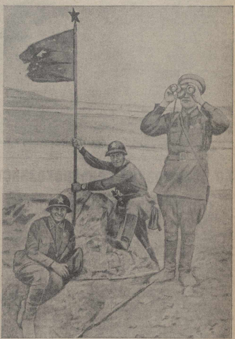
И годовщине победоносного штурма Красной Армией высоты Заозерной в районе озера Хасан. На снимке: командиры дальневосточники устанавливают на высоте Заозерной красный флаг, пробитый пулями и осколками гранаты.

во встречная монголо-советскими истребителями и огнем зенитной артиллерии, не приняв боя и не сбросив бомб, ушла на свою территорию, потеряв 2 самолета, сбитых преследовавшими ее монголо-советскими истребителями.