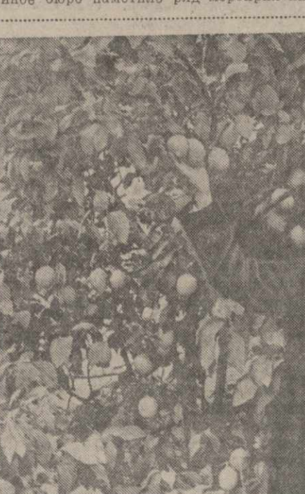
В оранжереях при павильоне Грузинской ССР на Всесоюзной сельскохозяйственной выставке. На снимке: лимонное дерево — экспонат совхоза «Гони».

Коллективы Мельничного комбината и Бумажной фабрики, добившись перевыполнения плана первого полугодия, сумели закрепить этот успех в июле. Партийная организация и дирекция Мельничного комбината правильно расставили кадры по цехам, бригадам, агрегатам, повседневно следят за ростом кадров, воспитывая их на практической работе. Выполнению плана комбинатом мешала плохая работа железнодорожного транспорта. По поручению партийного бюро бригада коммунистов ознакомилась с состоянием работы железнодорожного тупика. На этой основе партийное бюро наметило ряд мероприятий.