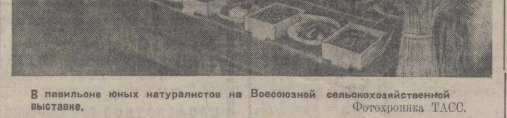
В павильоне юных натуралистов на Всесоюзной сельскохозяйственной выставке.

Порядкам на Джавском курорте должны вплотную заинтересоваться как Главное курортное управление, так и соответствующие организации Юго-Осетии.