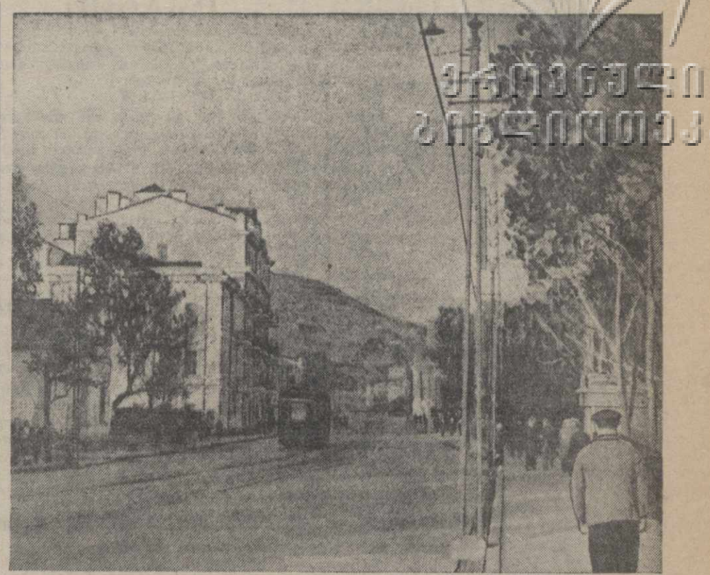
По городам Советского Союза. Улица Ленина во Владивостоке.

Гераниевое масло буквально распространяется на все золото. Благодаря своему аромату, обусловленному содержанием