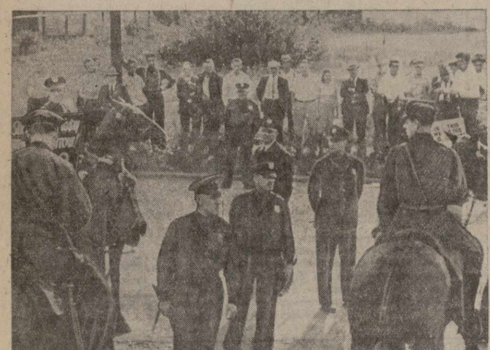
Стачечное движение в США. На заводе автомобильной фирмы «Дженерал моторс» в Детройте (США) предприниматели отказались возобновить коллективный договор. В знак протеста рабочие объявили забастовку. Во время стачки произошло несколько столкновений между забастовщиками и штрейкбрехерами, охраняемыми полицией. На снимке: пикет забастовщиков у завода.

ПРАГА 10. (ТАСС). Газета «А-зет» сообщает, что германский военный суд в Чехии и Моравии приговорил одного чеха, фамилия которого не приводится, к 5 мес. тюрьмы за «оскорбление германской армии». Это уже не первый случай осуждения военным германским судом чешских граждан и бывших чешских офицеров за «оскорбление германской армии».