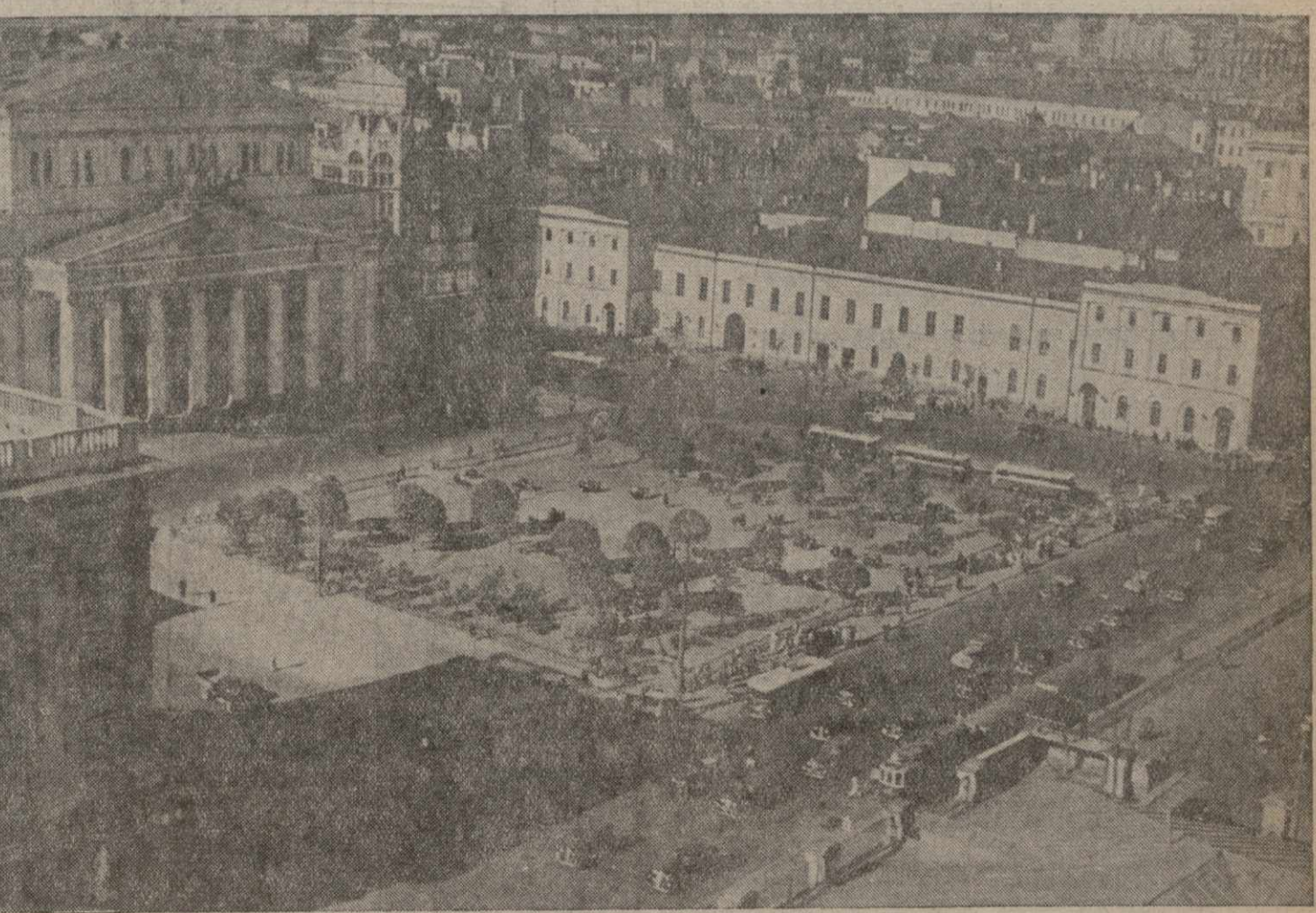
Москва. На снимке: вид на площадь Свердлова с крыши гостиницы «Москва».