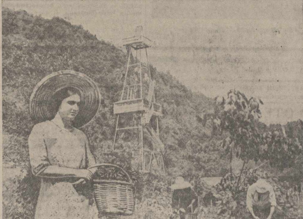
В Ланчхутском районе около реки Супсы среди чайных и цитрусовых плантаций высятся стройные нефтяные вышки. На снимке: буровая, находящаяся у плантаций колхоза имени Дзержинского.

К совещанию актива треста «Грузнефть», которое открывается в Тбилиси, я хочу внести предложение. Нашей нефтеразведке очень нужны рабочие руки. В колхозах Ланчхутского района есть немало молодых колхозников, желающих работать в нефтяном хозяйстве. Надо в колхозах провести разностороннюю работу. Я сам беру рассказывать в колхозах нашего Ланчхутского района о нефти, о ее значении, о развитии нефтяного хозяйства в Грузии. Пусть это сделают и другие наши нефтяники. Для молодых колхозников, желающих работать в «Грузнефти», надо будет опять организовать специальные курсы. Все это поможет быстрее подготовить новые кадры нефтяников Грузии.