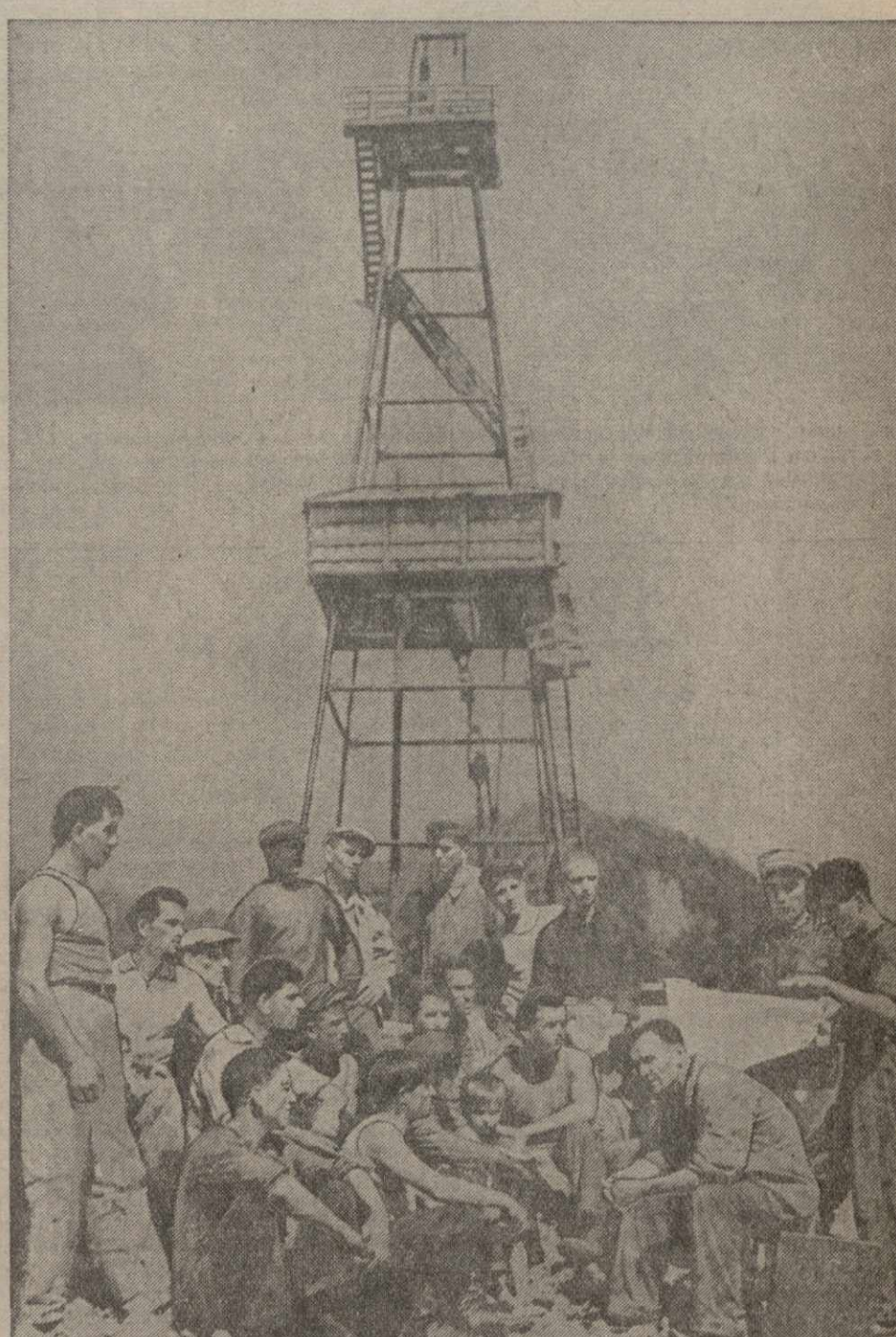
Нефтяная разведка в Супсе. Конференция бурльщиков, геологов и монтажников буровой № 8 перед пуском буровой в ход. Буровая начата проходкой 10 августа.

МОСКВА, 13. (ТАСС). Сегодня в Москву приехал коллектив Тбилисского драматического академического театра им. Марджанишвили. На вокзале гостей тепло встретили представители театральной общественности столицы.