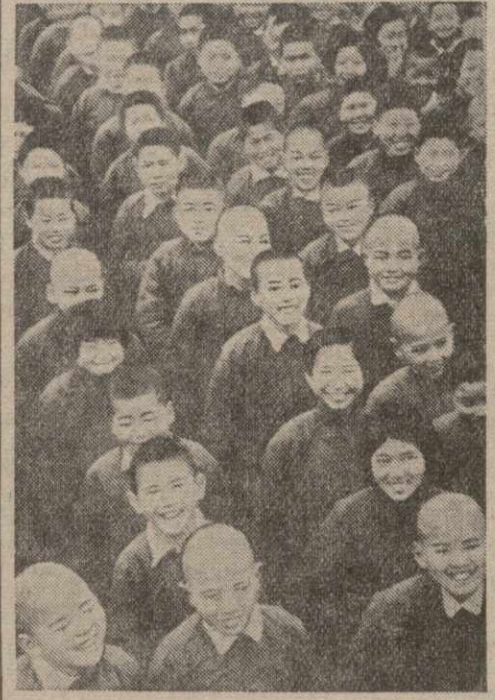
По всему Китаю созданы детские дома и школы для детей, лишившихся родителей в результате японской агрессии. На сним- ке: воспитанники китайского детского дома.

★ Министр иностранных дел Зотони Сальтер выехал в Латвию, где вел пере-