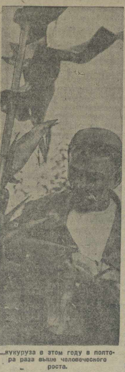
...кукуруза в этом году в полтора раза выше человеческого роста.