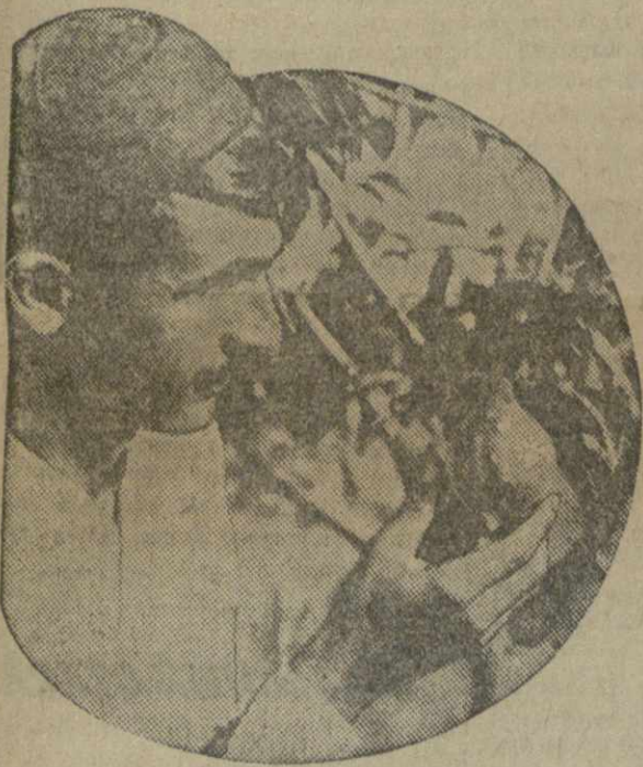
...хорошие груши в этом году выросли в колхозном саду.

Это никому не годится. Никто никому не давал права разбазаривать колхозные средства. Деньги надо высчитать и крепко предупредить правление, чтобы никаких посторонних должников у нас не было. Надо больше поднять бдительность. Отсутствием у нас бдительности и воспользовались враги народа, выхлупившие у доверчивого правления крупную сумму денег.