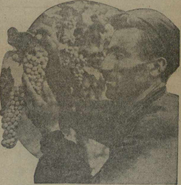
...наливаются соком крупные грозди винограда.

Я предостерегаю товарищей от того, чтобы на радостях от роста дохода забывать о дальнейших задачах. Возможностей у нас много, и если мы их используем деликатно, то будем еще богаче.