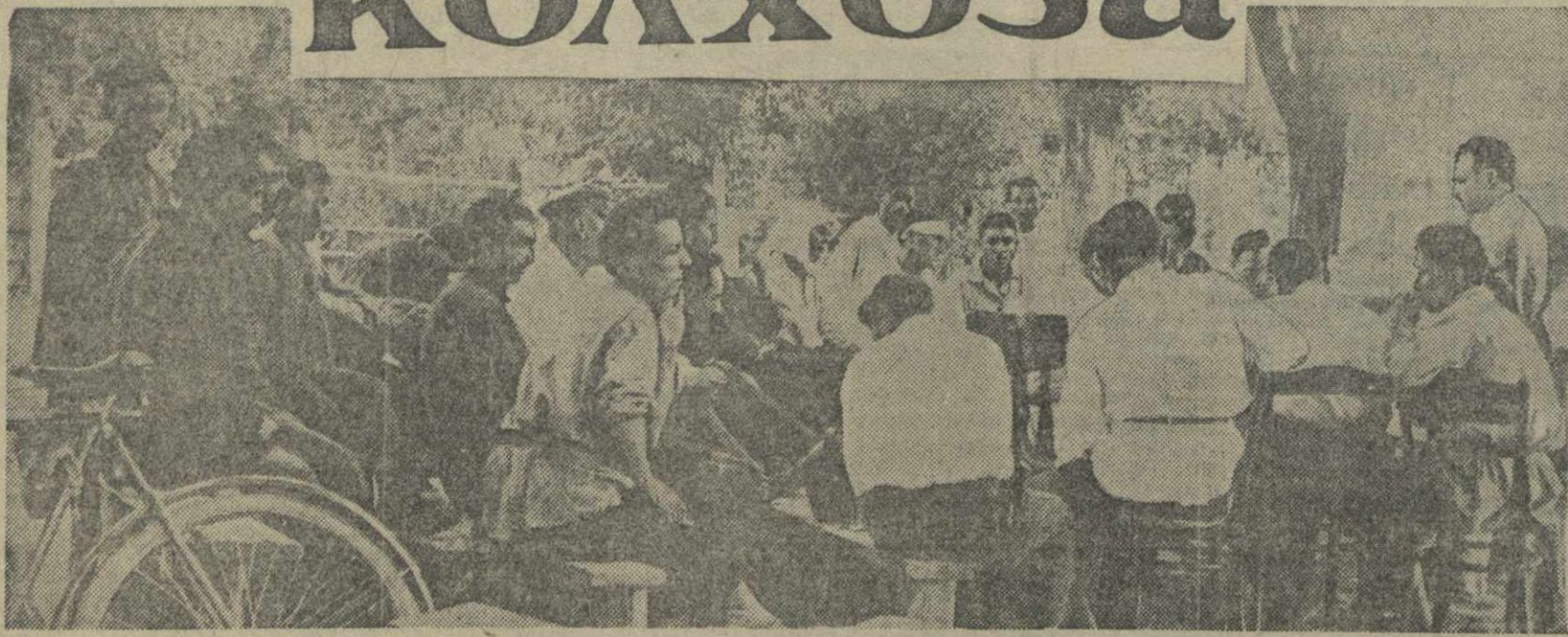
...правление и актив колхоза собрались обсудить — какой доход будет получен в этом году.

В прошлом году у нас почему-то при распределении доходов вызвали в пример на всю семью. Я считаю, что это неправильно. Каждый член колхоза должен сам получать свой доход. У нас есть случаи, когда жена выработывает больше мужа. Пускай такие мужья это почувствуют.