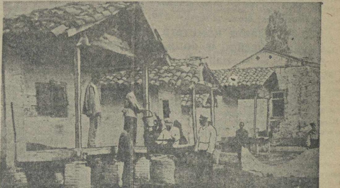
... в новые, специально выстроенные, амбары сложены семена для будущего года.