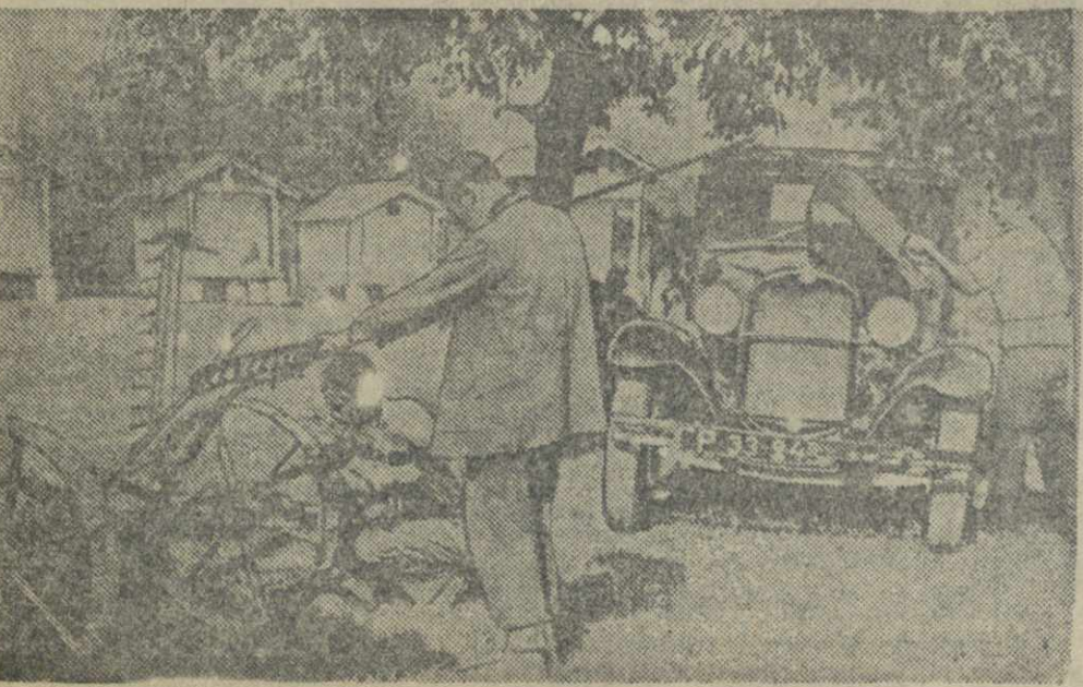
... после уборки внимательно осмотрели и отремонтировали машины.